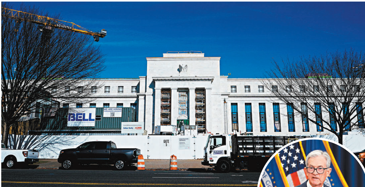
▲美聯儲將在美國時間9日和10日舉行議息會議，市場預期美聯儲今次將減息0.25厘的幾率十分高。圖為美聯儲辦公樓。

若進行另一次鷹派減息，則可能挑戰美聯儲的公信力，並鼓勵市場期待更多的寬鬆措施，且考慮到近期有關於鮑威爾潛在繼任者的消息，此舉甚至可能