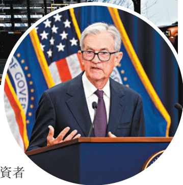
▶美聯儲主席鮑威爾