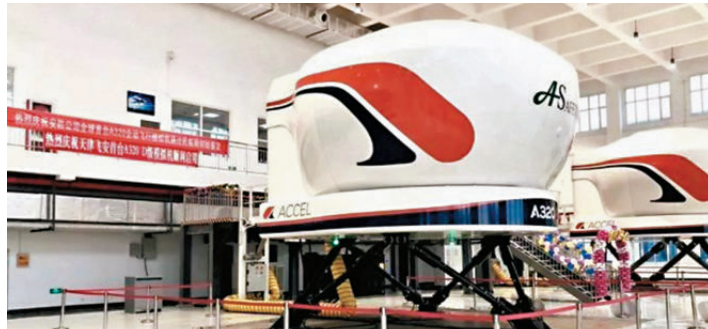
●中國製造的空客 A320 D 級全動飛行模擬機交付給法國 Simacro 公司。

模擬機飛行員培訓和模擬機工程解決方案提供商，總部位於法國，在全球設有 5 個培訓中心。作為上海華模科技有限公司在海外的重要戰略合作夥伴，Simacro 將依託交付設備為歐洲航空公司及學員提供高標準 A320 機型訓練。 「模擬機在技術上要求極高，同時還必須滿足非常嚴格的監管標準。本次交付的這款產品非常可靠、高效，華模科技的專業水準和活力給我們留下深刻印象。中國技術仍在蓬勃發展，我們期待看到華模科技帶來更多創新。」Simacro 首席執行官尼古拉·穆泰說。