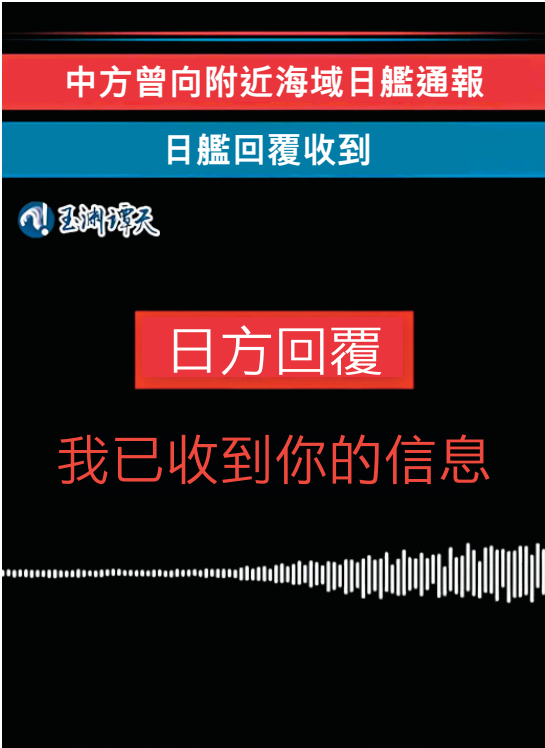
●「玉淵譚天」披露中日雙方軍艦通信錄音，錄音中，日方回覆收到中方的通報。 視頻截圖

按照中國海軍新聞發言人的介紹，日前，中國海軍遼寧艦航母編隊在宮古海峽以東海域正常組織艦載戰鬥機飛行訓練，事先公布了訓練海空域。