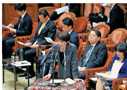
●高市早苗再次在國會發表爭議言論。

韓方對此深表遺憾。日方反覆提出毫無根據的領土主張，無助於構建面向未來的韓日關係，韓方敦促日方應清醒認識這一點。