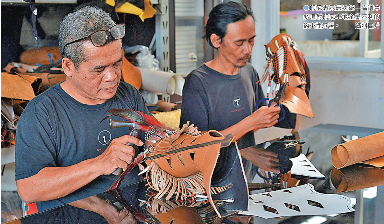
●印尼表示無法統一協議中多項對印尼本地企業不利的約束性承諾。 資料圖片

印尼經濟事務部回應稱，印尼仍在與美國磋商貿易協議，期待盡快達成對雙方均有利的條款。美國貿易代表格里爾本周將與印尼經濟統籌部長艾爾朗加會晤，以期解決雙方分歧。