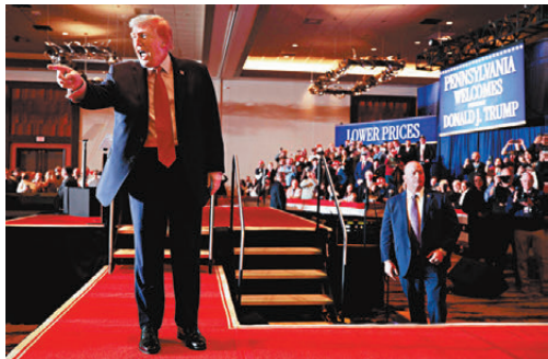
●特朗普到賓夕法尼亞州出席造勢活動。

香港文匯報訊 美國總統特朗普為挽救明年11月中期選舉選情，日前提早出席造勢活動，還接受傳媒專訪，自誇治下經濟成績非常好，更給自己打出「A+++++」的壓倒