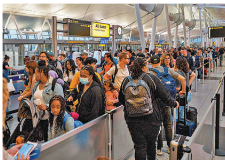
●美國計劃加強對入境人士的社媒審查。

香港文匯報訊 美國海關及邊境保衛局(CBP)周二(12月9日)提交新提案，宣布從全球42個免簽證國家和地區赴美的遊客，必須接受社媒