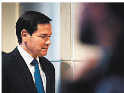
●魯比奧批評前任政府更換字體純屬多此一舉。

香港文匯報訊 特朗普政府接連推翻前總統拜登政府任內的多項決定。美國國務卿魯比奧周二(12月9日)頒令，要求國務院人員在官方