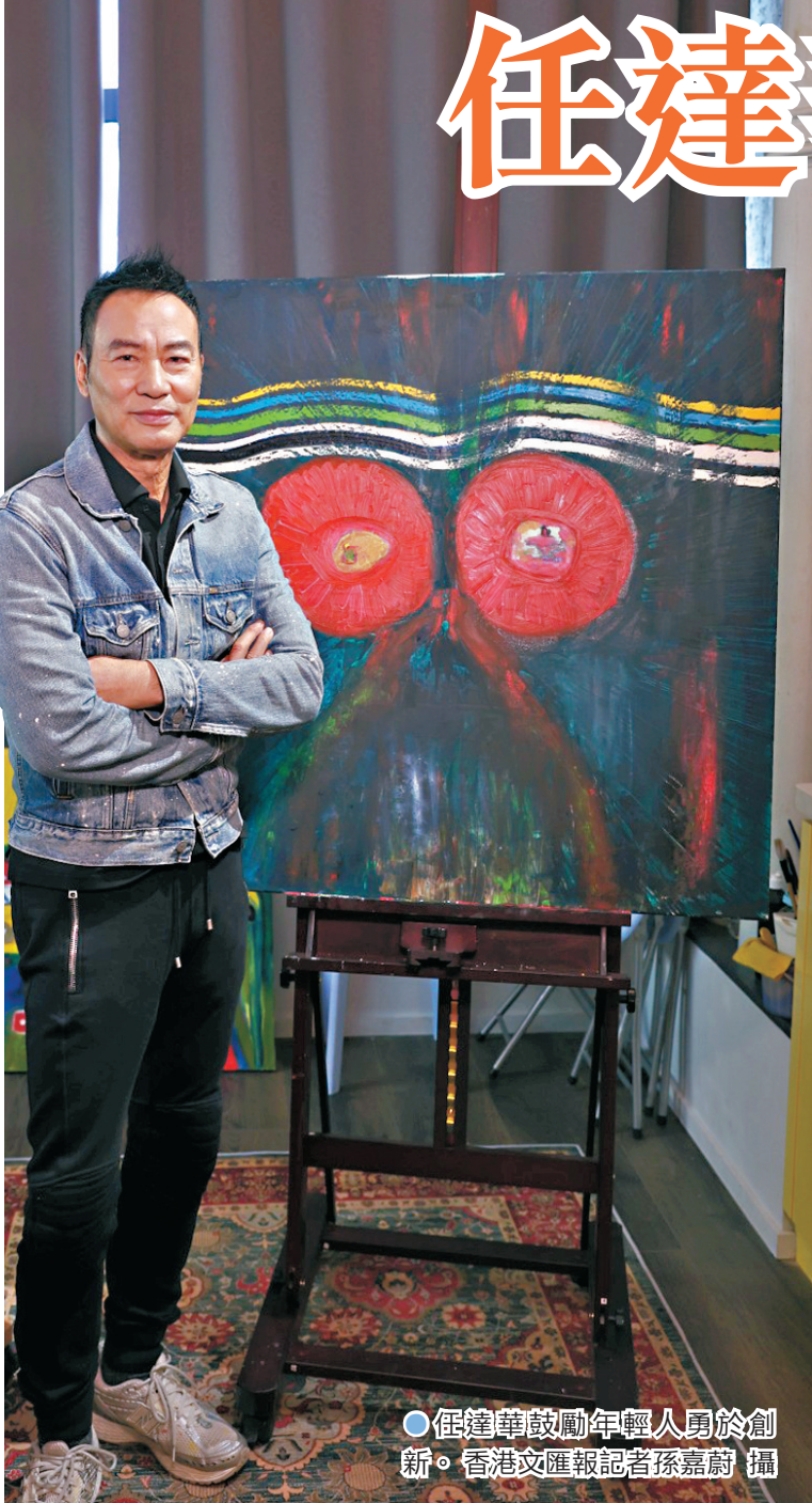
● 任達華鼓勵年輕人勇於創新。