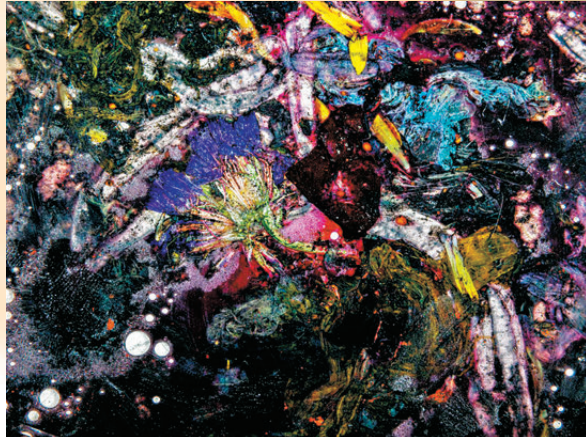
● 任達華創作千年後絢爛的維港。