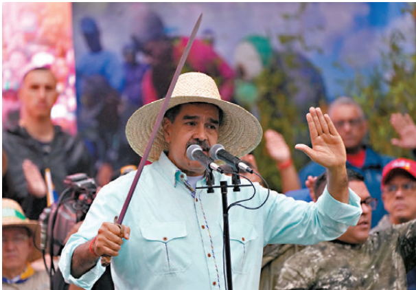
●特朗普不斷向委內瑞拉總統馬杜羅加強軍事施壓，引發將美拖入戰爭深淵的擔憂。

摩擦頻頻。加上美國在拉丁美洲激進推進所謂反毒行動，特朗普與佩特羅的緊張關係持續升級。9月15日，特朗普政府取消哥倫比亞的「反毒合作國」認證資格，哥倫比亞隨即宣布不再從美國購買武器。9月26日，佩特羅在紐約聯合國總部外參加支持巴勒斯坦的遊行抗議。美國國務院當天以佩特羅「煽動暴力」為由，吊銷他的赴美簽證。