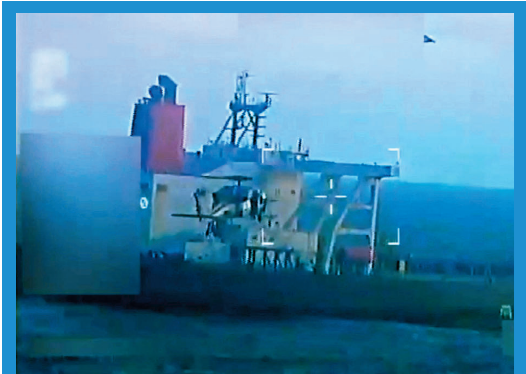
●美軍在委內瑞拉海外，扣押一艘懸掛圭亞那國旗的超大型油輪。

自特朗普1月重返白宮以來，美國和哥倫比亞關係持續緊張，在移民、關稅、禁毒以及巴以衝突等問題上