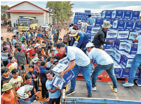
●柬埔寨避難民眾拿取物資。

香港文匯報訊 泰國和柬埔寨邊境衝突持續，美國總統特朗普宣稱會致電兩國領導人，要求平息衝突。不過泰國總理阿努廷周三(12月10日)表示，自己尚未接到特朗普致電，他已準備好向特朗