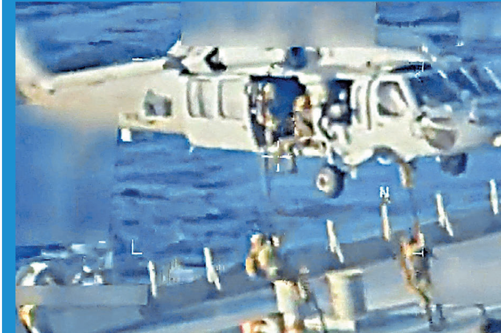
●美國武裝人員身穿迷彩服，從直升機用繩索速降登船。