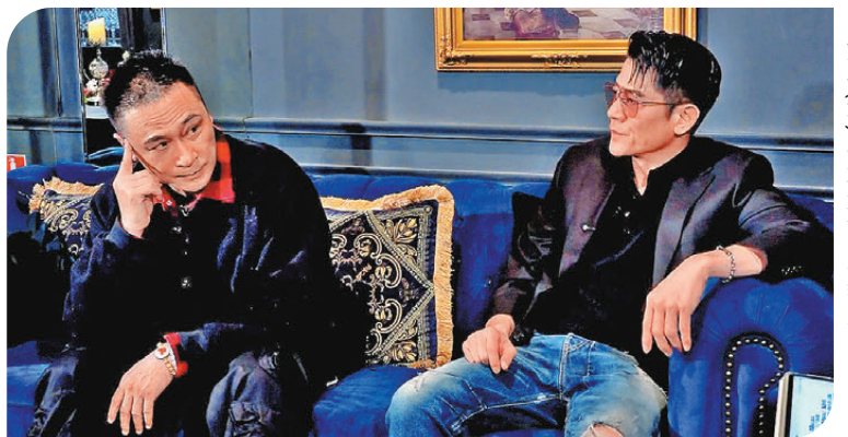
●鎮宇左與城談及家人。