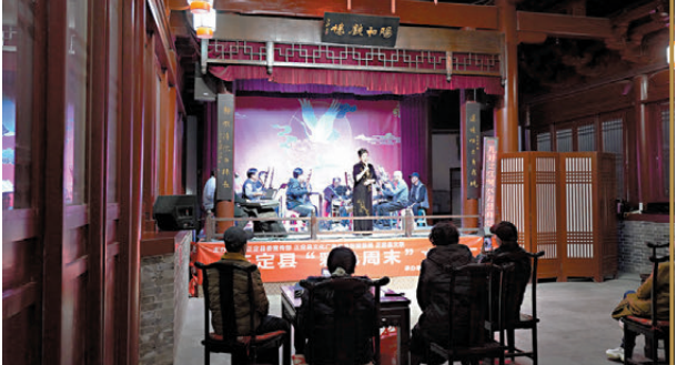
● 演員演唱河北梆子《哪吒》選段。

河北梆子發軔於草根，源自明末清初山陝梆子東傳，清道光至同治年間逐漸成熟，是中國梆子聲腔的重要支脈，亦是唯一冠有「河北」二字的主要地方劇種。二百年來，腔高板急的河北梆子唱遍鄉間閭裏，並於2006年被列入第一批國家級非物質文化遺產名錄。 ●文：中新社