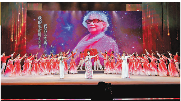
● 「永遠的紅線女——紀念紅線女誕辰100周年專場」晚會在廣州舉行。

「永遠的紅線女——紀念紅線女誕辰100周年專場」早前在廣州舉行，當晚雲集20多位中國戲劇梅花獎得主，包括丁凡、歐凱明、曾小敏、李淑勤、倪惠英等，以及郭鳳女、瓊霞、蘇春梅等紅派傳人之外，也有來自海內外的戲劇名家、戲曲新秀，以經典之作緬懷粵劇宗師紅線女。 專場演出以「典範流芳」「異聲同韻」「赤誠丹心」「弦歌綿延」等篇章為軸，精選紅線女藝術生涯中具有里程碑意義的作品。當晚有香港粵劇名伶