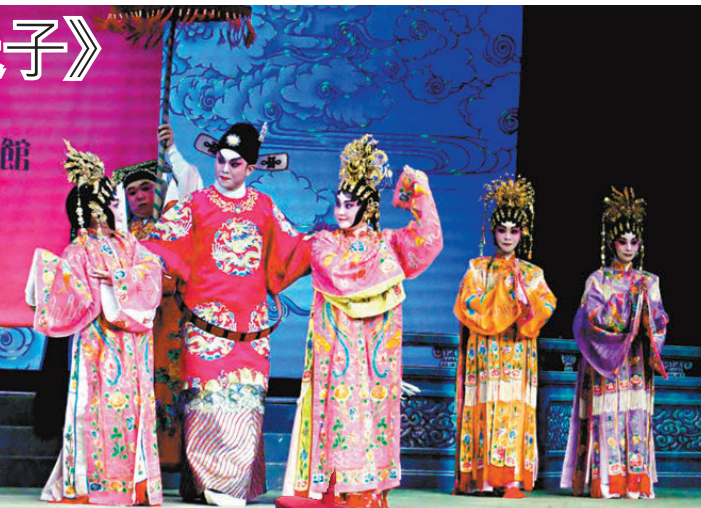
▲ 仙姬大送子為《香花山大賀壽》的壓軸演出，鼓樂喧天，襯托董永尋找七位仙女、仙女們展演反宮裝的排場及身段。

專為神誕而演的粵劇傳統例戲，先演全劇兩小時的《香花山大賀壽》，觀眾都投入鑼鼓喧天、五花八門不同角色的神誕戲之中，緊接着便會演出《仙姬送子》。 《仙姬送子》講述七姐下凡將新生嬰兒送還董永的過程，粵劇行內有不同的版本，基本上是《大送子》《小送子》，而隨《花山大賀壽》上演的是《大送子》，劇中董永在七位仙女中找尋七姐，七位仙女隨鼓樂聲展演變裝身段，瞬即變裝為七彩宮裝，有如變魔術，為相當賞心悅目的戲曲身段。 ●文：白若華