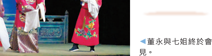
◀ 董永與七姐終於會見。