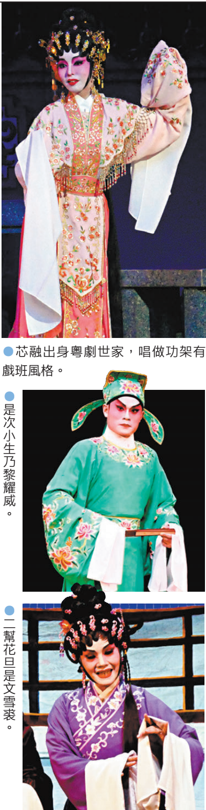
● 芯融出身粵劇世家，唱做功架有戲班風格。