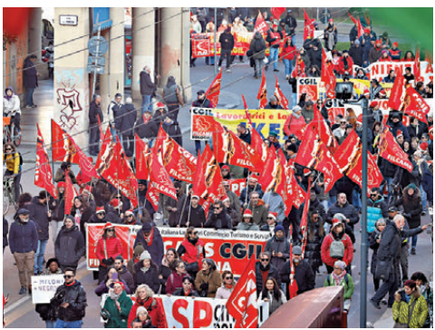
●意大利全國有50萬人參加示威。

香港文匯報訊 意大利最大工會上周五(12月12日)發動全國大罷工，抗議政府的預算案忽略民生需要。