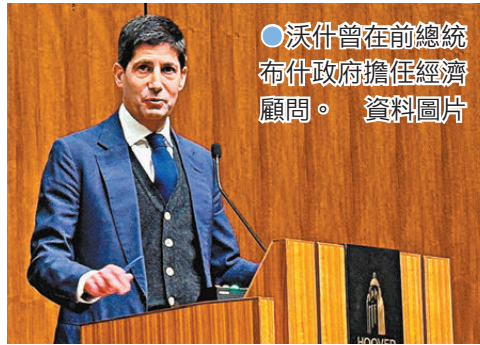
●沃什曾在前總統布什政府擔任經濟顧問。 資料圖片

問，2006至2011年出任聯儲局理事。特朗普2017年曾為聯儲局主席職位面試過沃什，但最終選擇鮑威爾。