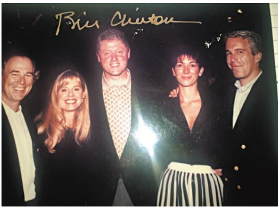
◀愛潑斯坦遺物照片出現美國前總統克林頓(中)身影。

香港文匯報訊 美國民主黨國會議員再公開已故淫媒愛潑斯坦涉及性交易案的相關文件，多張可見美國總統特朗普、前總統克林頓等名人身影的相片曝光。特朗普回應稱對此不知情，又表示「沒什麼大不了」。