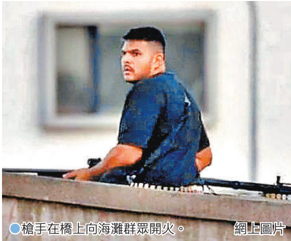
●槍手在橋上向海灘群眾開火。

香港文匯報訊 澳洲悉尼著名旅遊景點邦迪海灘於周日(12月14日)下午發生嚴重槍擊案，造成11人遇害及60人受傷，其中一名槍手被警方擊斃，警方確認事件為恐怖襲擊。事發時當地猶太社區正在海灘舉行猶太教「光明節」慶祝活動，槍擊導致歡樂時刻瞬間陷入混亂與悲痛。當局接報指現場被放置爆炸裝置，警告民眾遠離該區，其後成功從其中一名槍手的車輛中移除爆炸裝置。