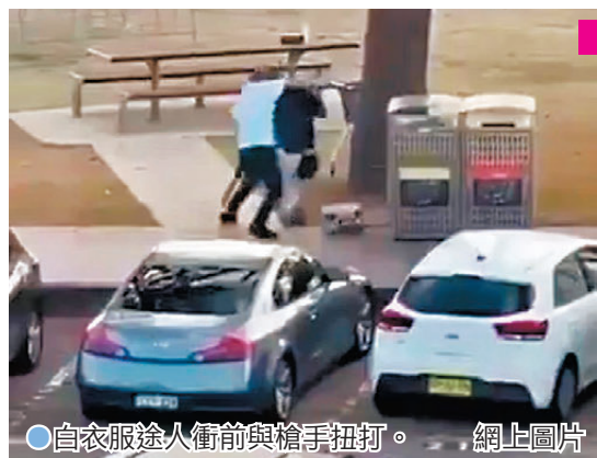
●白衣服途人衝前與槍手扭打。

有民眾透露，起初以為聽到的巨響是在放煙火，後來才發現是槍擊，即時慌忙逃生。社媒X上流傳的影片顯示，群眾聽到密集槍聲後紛紛尖叫逃離。澳洲廣播公司(ABC)報道，一名在現場參加光明節活動的目擊者透露，他目睹兩名身穿黑衣槍手站在停車場附近的行人天橋上，掃射聚