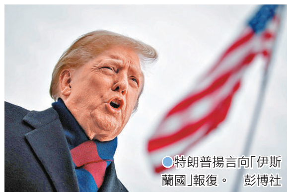
●特朗普揚言向「伊斯蘭國」報復。

自巴沙爾政權去年倒台後，敘利亞與西方國家關係有所改善，過渡總統沙拉上月曾到訪華盛頓，與特朗普會面。