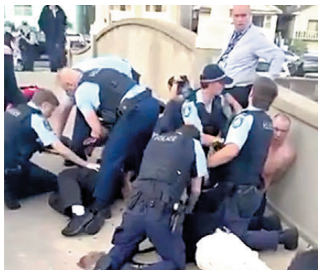
●警員衝上橋制服槍手，有民眾乘機用腳踢槍手洩憤。

澳洲近年罕有發生槍擊案，今次恐襲嚴重衝擊當地社會，事件在節日期間於著名景點發生，更令民眾不安，警方強調將全力維護公眾安全。