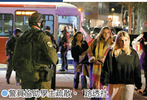
●警員協助學生疏散。

由於槍手起初在工程和物理學院大樓附近開槍，有學生表示起初以為槍聲是學校木工車發出的聲音，或是實驗出錯而發出的爆炸聲，校方後來才正式發布校園有槍手的緊急警報。學生阿莫西的母親受訪時透露，包括其兒子在內的不少學生都在校園備試，卻沒想到會因而陷入槍擊事件。她表示兒子留下令人心碎的短訊稱：「媽媽，校園發生槍擊事件。我要逃跑了，我愛你。」她得知兒子與另外12名學生事發後躲到儲物室，並以椅子堵塞入口。