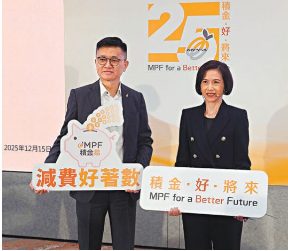
●圖右為積金局主席劉麥嘉軒。

關於強積金供款入息上下限檢討，以及強積金全自由行的議題，劉麥嘉軒表示，上述議題都將會是積金局明年的重點工作。其中，她表示強積金供款入息上下限會在明年中進行檢討，並向香港特區政府遞交建議；至於強積金全自由行，她表示預計明年底會實踐首階段工作。