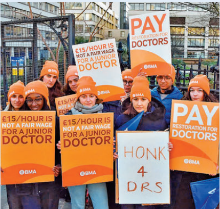
●英住院醫生今起罷工5天。網上圖片

香港文匯報訊 英國超級流感疫情席捲全國之際，英格蘭住院醫生周一（12月15日）表決通過在周三展開一連5日罷工行動，將是自2023年3月以來醫護人員的第14次罷工，首相斯塔默直斥此舉不負責任，指醫生已失去公眾和國家醫療服務（NHS）同僚的同情。