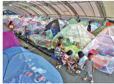
●泰民眾在臨時避難所。

光，觀光部數據顯示去年外國旅客人數突破670萬人，創歷史新高，但今年7月至9月的入境人次，仍較2019年疫情前減少約三分之一。吳哥企業公司統計，6月至11月期間，吳哥考古園門票銷售額按年減少17%。