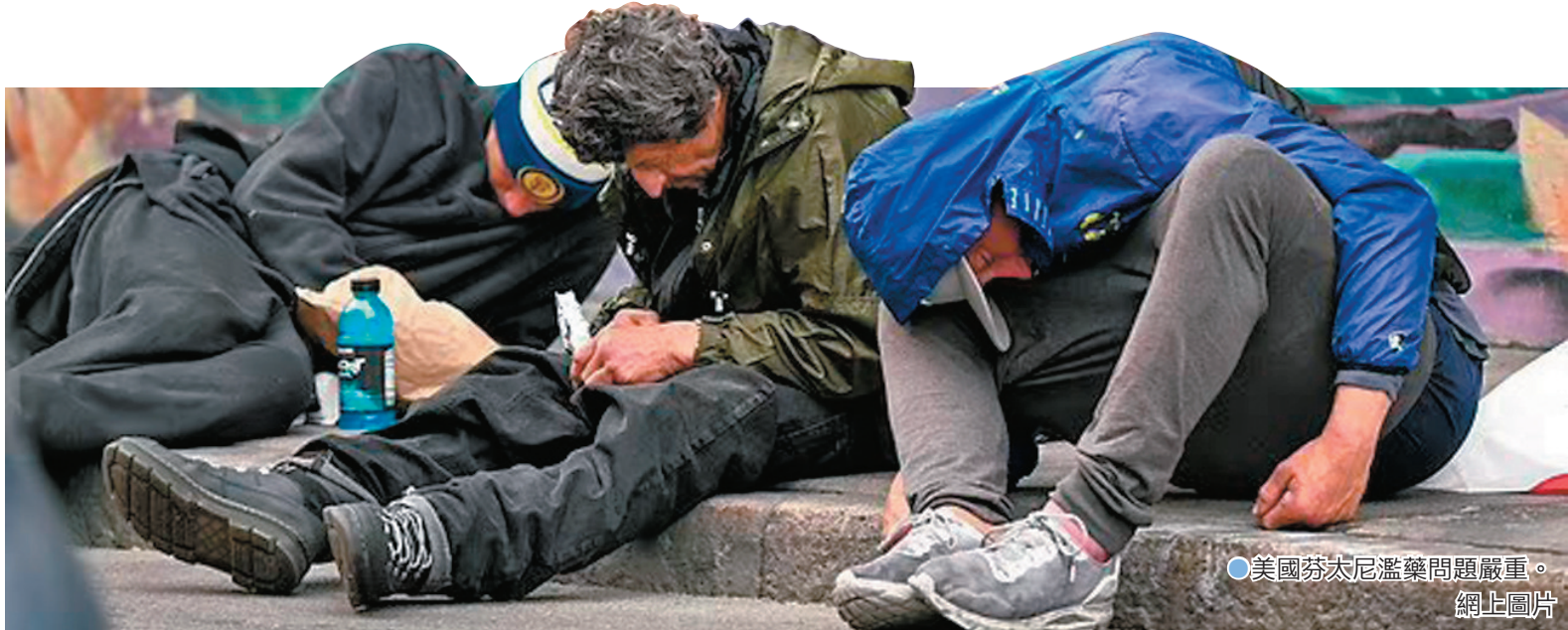
●美國芬太尼濫藥問題嚴重。

面對質疑，國防部新聞秘書威爾森為行動合法性辯護，稱美軍南方司令部的行動無論依照美國法律或國際法都是合法，所有行動都遵守武裝衝突法律。但分析指出，這些海上攻擊可能被視為美國未來對委內瑞拉等地發動地面軍事行動的前奏。特朗普此前已多次威脅要對委內瑞拉、哥倫比亞和墨西哥採取地面行動，以打擊毒品走私。委總統馬杜羅稱，美國的掃毒行動只是其尋求在委實現政權更迭、並在拉美進行軍事擴張的藉口。而美國緝毒署近年的報告顯示，委國並非流入美國毒品的主要來源地。