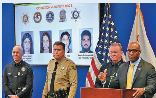
●FBI宣布破獲反政府組織炸彈陰謀。美聯社

香港文匯報訊 美國聯邦調查局（FBI）周一（12月15日）宣布破獲左翼反政府組織擬於除夕夜，在洛杉磯5個地點發動炸彈襲擊的陰謀，拘捕4人，控告串謀和持有爆炸裝置等罪名，若罪成將分別面臨最高5年和最高10年監禁。