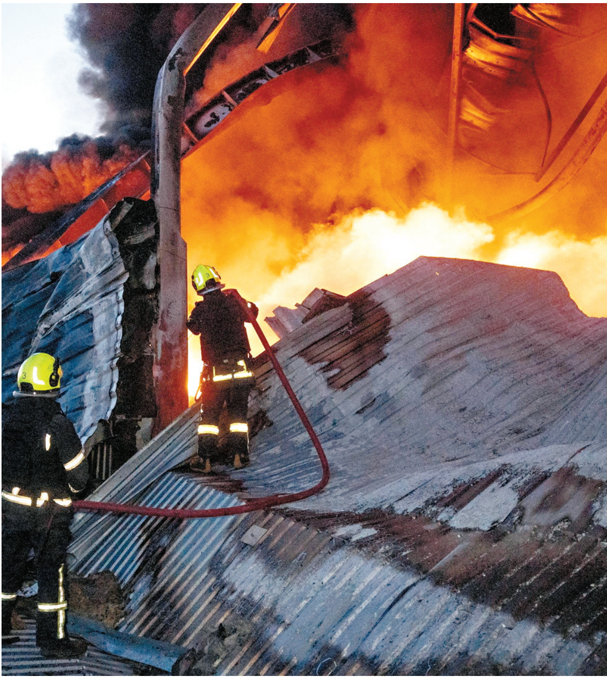
●俄羅斯無人機夜襲烏克蘭敖德薩，一處家用電器倉庫着火。

目前俄烏局勢依然膠着，美國主導的安全保障倡議，被視為穩定烏長期防務態勢的關鍵舉措，旨在向俄傳遞西方持續支持烏的明確信號，同時為烏提供衝突後的安全藍圖。然而該保障的具體實施，完全取決於衝突何時及如何結束。美政府高級官員透露，相關安全保障的討論，將在即將舉行的北約峰會上與盟友進一步協調。最終協議的成型與效力，將深刻影響戰後歐洲安全秩序的構建，以及烏作為主權國家的未來道路。