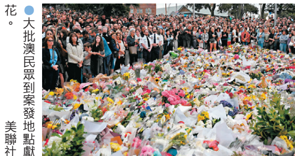
●大批澳民眾到案發地點獻花。

香港文匯報訊 澳洲悉尼邦迪海灘周日（12月14日）發生嚴重槍擊事件，總理阿爾巴尼斯周二到醫院探望英勇奪下槍手武器的水果店老闆艾哈邁德，讚揚對方代表了國家最優秀的一面。阿爾巴尼斯同時指出，涉案兩名槍手可能受到極端組織「伊斯蘭國」（ISIS）的意識形態驅動。