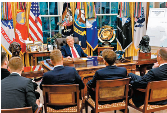
●歐多國領導人考慮直接與美談判。圖為他們早前到白宮見特朗普。

香港文匯報訊 據英國《金融時報》周一（12月15日）報道，歐盟面對美國總統特朗普的持續施壓選擇保持沉默，引發內部成員國不滿，部分歐洲國家領導