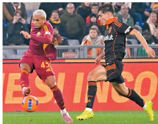
●韋斯利雲尼索斯（左）替羅馬奠勝。

雖然球隊表現出色，但加斯柏連尼表示球隊還未是時候談論爭冠：「我傾向於我們未有能力爭冠，因為有一些球隊明顯較我們更好。話雖如此，我的球員每場均會拚盡全力，我們現在已是一支不錯的球隊，並正在努力變得更強，相信任何球隊想要戰勝我們均不會輕鬆。」