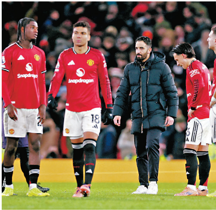
●曼聯將帥賽後均對戰果感到失望。

曼聯今場只要取勝便能夠追至與第四名的車路士同分，但失分後落後車路士兩分，排在第六位。