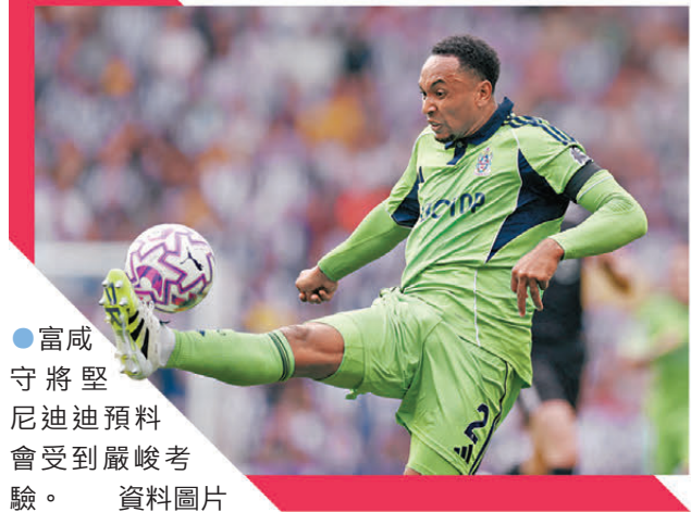
●富咸守將堅尼迪迪預料會受到嚴峻考驗。資料圖片