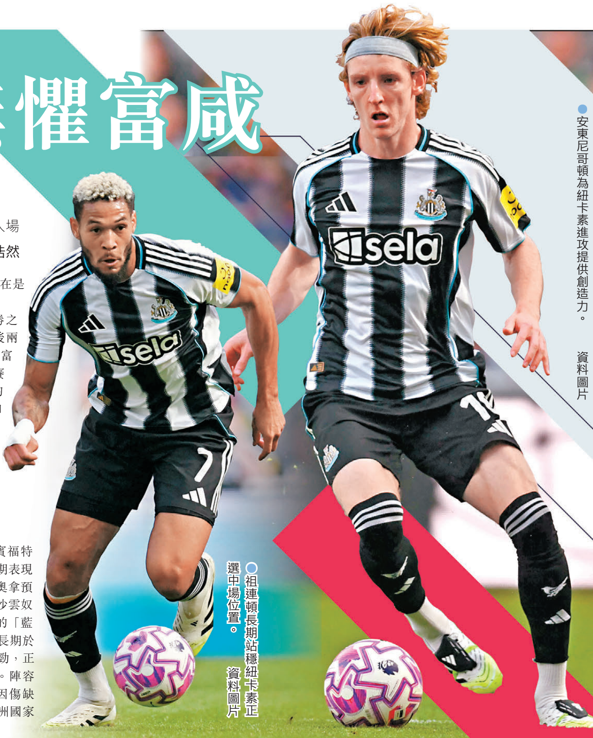
●安東尼哥頓為紐卡素進攻提供創造力。

同日英聯盃半準決賽賽事還有曼城主場對賓福特（myTV Super周四3：30a.m.直播）。曼城近期表現勇銳，正式比賽已累積五連勝，雖然主帥哥迪奧拿預計會作出輪換，但就算改以馬莫殊、艾洛利、沙雲奴等副選出擊，以這批球員的質素，有主場之利的「藍月亮」該仍能維持一定戰力。至於賓福特今季長期於聯賽榜中下游徘徊，球隊近況和客場賽績亦差勁，正式比賽三場不勝（一和二負）兼客場四連敗。陣容上，中後場主力安東尼米林保和艾朗希基均因傷缺陣，另一中場核心丹高奧達拉則已歸隊備戰非洲國家盃，中後場人腳不整下，是役看來難逃一敗。