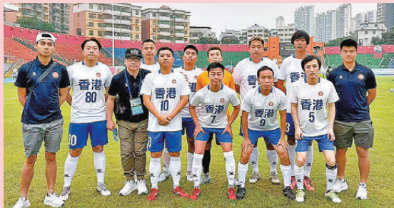
●港足隊員期待加強與內地賽事、場地資源優勢互補。