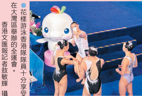
●花樣游泳香港隊隊員十分享受在大灣區舉辦的全運會。

十五運會和殘特奧會期間，粵港澳三地建立了「1+4」的粵港澳聯絡機制，三地在跨境賽事、口岸通關及食品安全等多個重點領域達成共識，探索出「同頻溝通、同心決策、同步執行」的「三地三同」聯合辦賽模式。