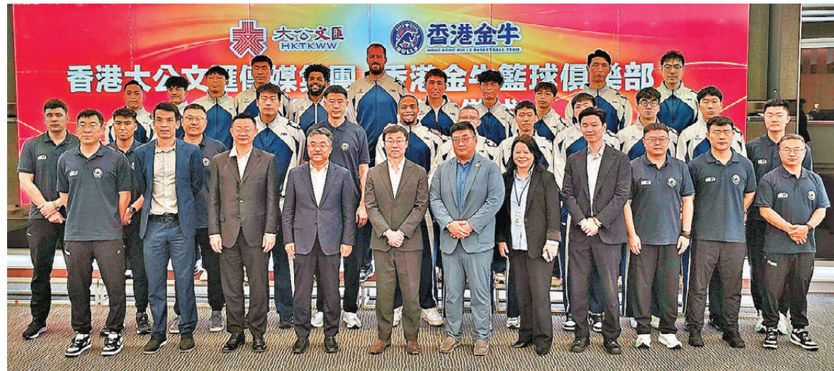
●香港金牛再度補強，新球季劍指三連霸。

主場安排方面，由於金牛過往三季沿用的主場灣仔修頓室內場館未符合國際籃球聯合會（FIBA）相關場地標準，球隊正積極嘗試尋找合適場地。新賽季首場主場賽事將於12月24日平安夜上演，對手為上海玄鳥，比賽地點將稍後公布。