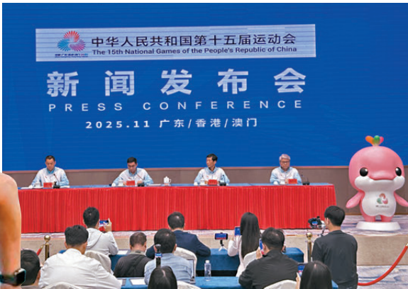
●粵港澳探索出「同頻溝通、同心決策、同步執行」的「三地三同」聯合辦賽模式。圖為三地聯合舉辦十五運會籌備記者會。