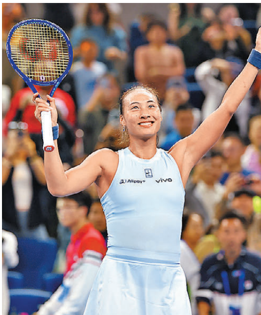
▲鄭欽文深受中外球迷喜愛，蟬聯人氣獎實至名歸。