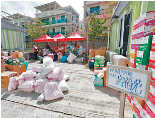
●有宏福苑受災居民入住大埔的過渡性房屋「樂善村」。資料圖片

香港文匯報訊 因應近日有關宏福苑居民居住期限的不實訊息，香港房屋協會昨日作出澄清強調，為宏福苑居民提供的應急住屋安排，包括過渡性房屋、出租屋邨和專用安置屋邨的空置單位，目前均沒有設定居住期限。