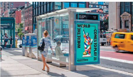
●紐約展示世界盃宣傳海報。

特朗普在本月初的分組抽籤儀式上，獲國際足協頒發新設立的和平獎，有批評者抨擊這種互相矛盾的信息令人震驚。國會參議院外交關係委員會成員、馬里蘭州民主黨參議員范霍倫批評，世界盃本應是世界各國團結、擱置分歧的象徵，但特朗普卻試圖將世界拒之門外，與世盃精神背道而馳。由於擔憂簽證問題或出於對特朗普的不滿，部分球迷已放棄前往美國，將轉往加拿大或墨西哥觀賽。