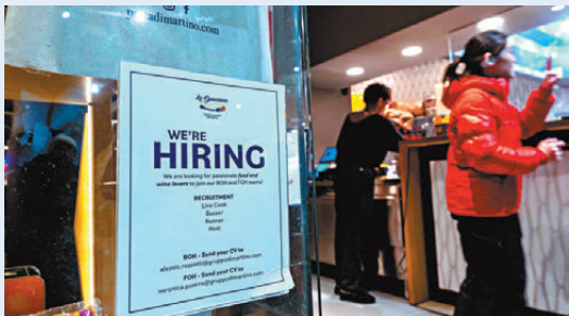
●紐約一間餐廳貼出招聘廣告。

香港文匯報訊 美國勞工部周二（12月16日）公布的官方數據顯示，美國11月失業率再度攀升，升至4.6%，創下2021年9月以來最高水平，凸顯美國勞動市場正在降溫。