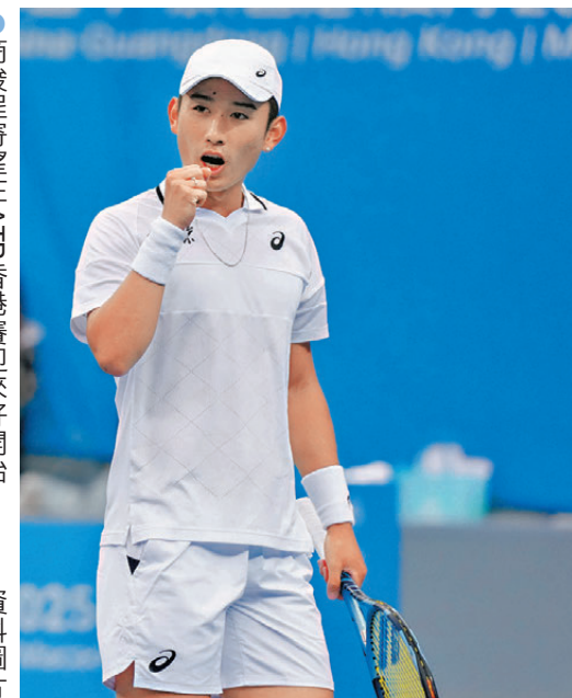
●商竣程寄望在ATP香港賽迎來好開始。