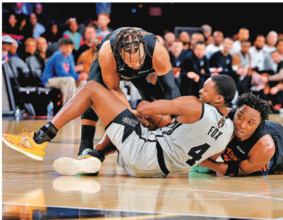
●紐約人(藍衫)的鐵血防守令馬刺陷入苦戰。

塞爾特人在積遜達頓賽季報銷下成績大幅下滑，騎士及76人等傳統強隊今季亦未見起色，表現持續穩定的紐約人今季迎來稱霸東岸的最佳時機，目前紐約人在東岸排名第二，距離第一的活塞僅2.5場，在整體陣容佔優下，相信升上榜首只是時間問題。對紐約人而言，在NBA盃稱王只是他們重拾輝煌的第一步，東岸冠軍以至總冠軍才是終極目標，NBA盃證明他們已經完成蛻變，兼具「硬淨」防守和得分爆炸力下，如球隊陣容能夠保持健康，紐約人毫無疑問是衛冕冠軍雷霆的最強挑戰者之一。