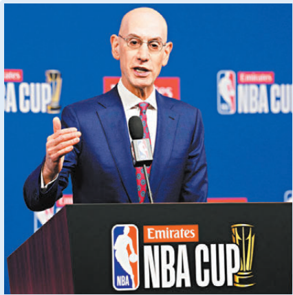
●蕭華就NBA擴軍事宜表態：雅圖與拉斯維加斯為熱門地點。