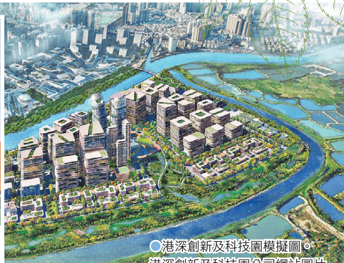
○港深創新及科技園模擬圖。