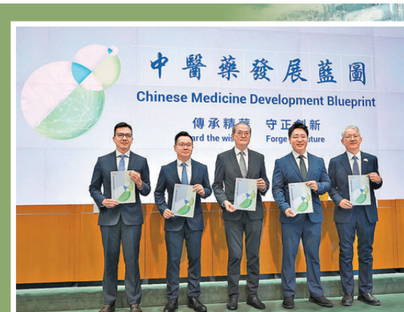
●醫務衛生局昨天公布香港首份《中醫藥發展藍圖》。

同時，政府會從成分及藥名方面着手，例如成分，若產品含有或聲稱含有「僅用於藥用的中藥材」，均認為中成藥，必須完成註冊才能作為中成藥在市場銷售。至於部分與知名中成藥名稱高度相似但成分與真正配方毫無關係的產品，則在法例中增設附表，納入公眾耳熟能詳的中成藥名稱，以杜絕目前規避監管的情況。