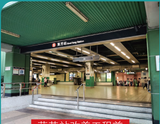
葵芳站改善工程前

不少港鐵車站服務社區已逾四十年，港鐵公司多年來持續推出各項車站改善工程，提升站內環境，為顧客帶來更舒適的乘車體驗。港鐵最近完成了荃灣綫葵芳站及東鐵綫沙田站的車站改善工程，讓我們一起看看這兩個車站的新面貌！