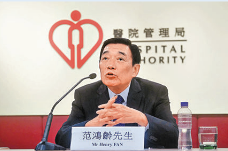
●醫管局主席范鴻齡

對於工程分判商疑在瑪嘉烈醫院荔景大樓擴建工程中，提交偽造監測震動儀器校正證明，李夏茵表示已報警處理，事件仍在調查中，該儀器旨在測試施工對醫院運作的影響，包括塵埃和聲響等，絕不會影響建築安全，一般情況下亦不會單