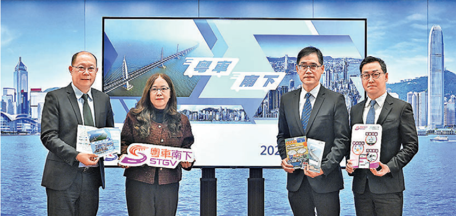
●運輸署昨表示，粵車南下各項措施已準備就緒，迎接粵車由12月23日起入境香港市區。

為配合粵車南下計劃，昂坪360推出泊車優惠，同時與東薈城名店倉合作推出「昂坪360——粵車南下優惠套票」，由即日起，持有效「香港運輸署粵車南下（入境市區部分）車輛預約確認憑證」的旅客，透過攜程App購