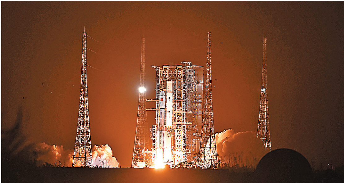
●圖為搭載天舟九號貨運飛船的長征七號遙十運載火箭點火發射。資料圖片

修、設備組裝、科學實驗乃至「太空直播授課」。每一次在鏡頭前從容的微笑、每一次精準的操作、每一堂生動的天宮課堂，都在向世界展示着中國航天員的非凡素質與開放自信。