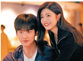
●《狙擊蝴蝶》劇照

在現今追捧明星偶像的風氣下，無可否認劇集還是以她作為宣傳重點，但如果喜歡深入探討劇集故事的話，可探索劇中描繪城市「姐弟戀」的社會現象。