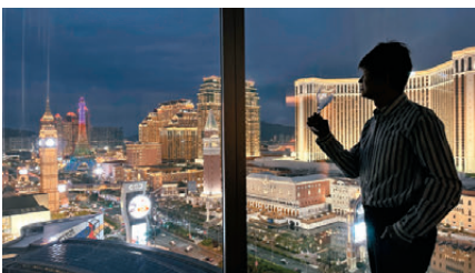
●筆者攝於澳門金光大道旁的頤居酒店。作者供圖

我相信如果你最近20年沒有來過澳門，肯定分不到方向，不止因為這裏滄海桑田，也因為香港沒有一處地方集中了20多間五星級酒店，而且一個度假村有九家酒店，一個品牌同一屋簷下又有四家酒店，令人眼花繚亂，但這正是我每年去澳門數次的原因，想多住幾間不同品牌酒店，最好住勻25間金光大道酒店。