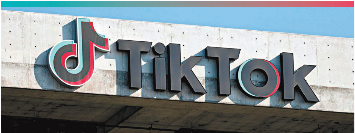
●當地時間12月18日，TikTok首席執行官周受資發出內部信稱，字節跳動、TikTok已與三家投資者簽署協議，並將成立一家名為「TikTok美國數據安全合資有限責任公司」的新的TikTok美國合資公司。