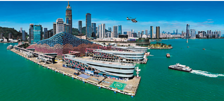
●專家指出，「新18條」有利前海打造具備多式聯運及快速通關等核心功能的綜合性樞紐。