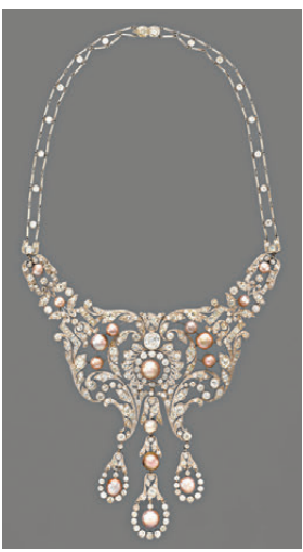
●項鍊，Dreier & Co. (1868-1927年) 紐約大都會藝術博物館藏