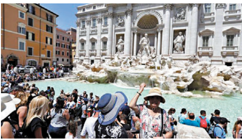
●羅馬許願池深受遊客歡迎。

嘉提耶里估計，新措施每年可為羅馬市政府帶來650萬歐元（約5,924萬港元）收入。除許願池外，羅馬的另外5個景點明年2月起也將收取門票，票價為5歐元（約45.6港元）。羅馬的主要景點之一萬神殿已於2023年起收取門票。