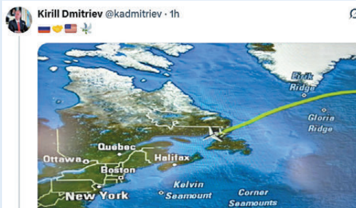
●德米特里耶夫在社媒上發帖配上和平鴿貼紙。

香港文匯報訊 俄羅斯總統特使德米特里耶夫上周六（12月20日）宣布，他正前往美國佛羅里達州邁阿密，將與美方代表舉行新一輪俄烏和平協議談判。德米特里耶夫在社媒上發帖配上一個和平鴿貼紙，宣稱有「戰爭販子」正在破壞美國推動的和平計劃。