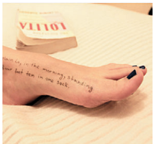
●有受害人腳上寫有《蘿莉塔》內容。

香港文匯報訊 美國國會眾議院民主黨監督委員會上周五（12月19日）也公布愛潑斯坦案的68張最新相片，當