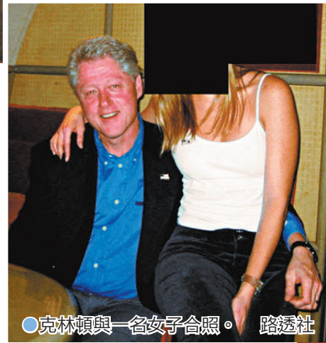
●克林頓與一名女子合照。