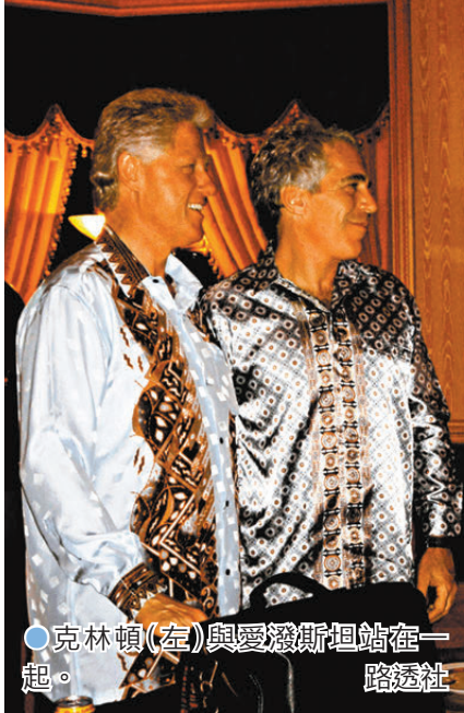
●克林頓(左)與愛潑斯坦站在一起。