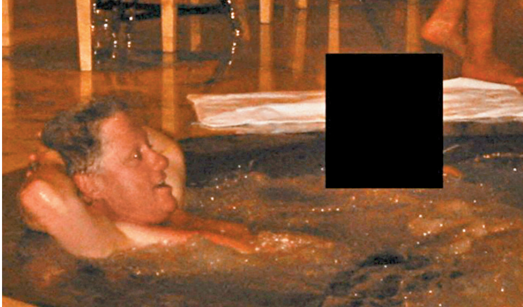
●克林頓在按摩池與一名身份未明人士共浴。