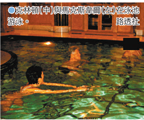
●克林頓(中)與馬克斯韋爾(左)在泳池游泳。