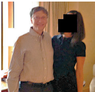
●蓋茨(左)現身新公布相片。