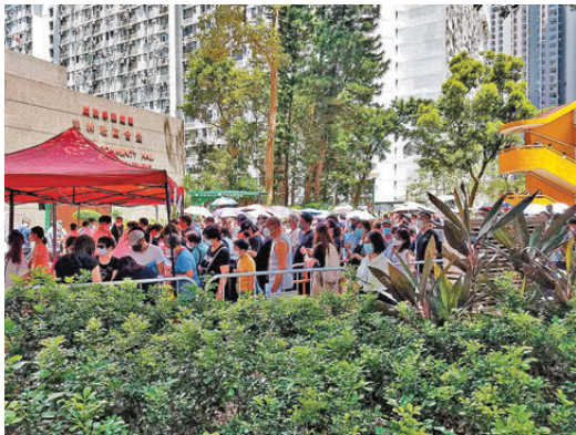
▲▼小業主冒著烈日排長龍，就是為了前往大會反對法團提議。

法團內部不同人士對於顧問公司由誰聘請說法並不一致，懷疑所謂缺席的顧問公司可能並非如法團所說是政府聘請，而是法團以1萬元聘請，整場戲碼可能就是顧問公司和法團唱雙簧，一個不露面一個強行投票，「幾十萬就玩到咁，之後大維修真係唔敢想像！」