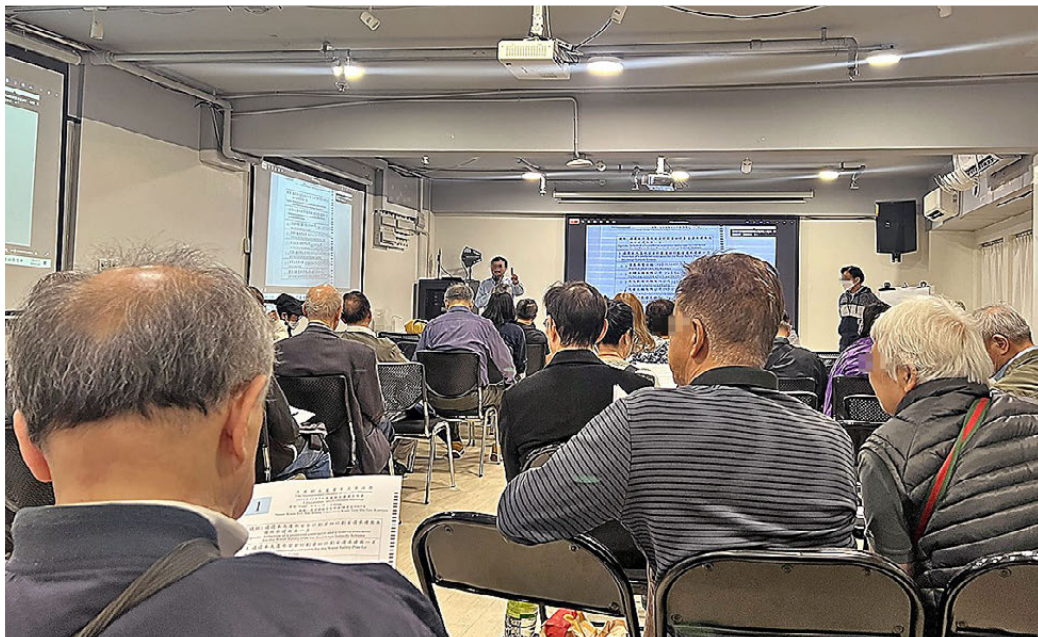
●記者潛入尖沙咀舊樓業主大會現場，雖然諸多業主表達不滿，但法團代表仍不斷催促業主盡快投票。

全港舊樓維修每年工程費高達數百億元，吸引圍標集團垂涎，業主立案法團本應是當中的「防火牆」，確保工程招標透明、清廉、高效。不過，香港文匯報經數月深入多個舊樓立案法團會議，直擊小業主聲音不被法團正視，更發現疑似「職業法團主席」頻頻擔任多幢大廈法團主席，意圖可疑。一名工程界「吹哨人」踢爆圍標常用套路，記者並邀請多名專家集思廣益，為特區政府獨立委員會獻計堵塞目前的漏洞，將一連四輯報道。