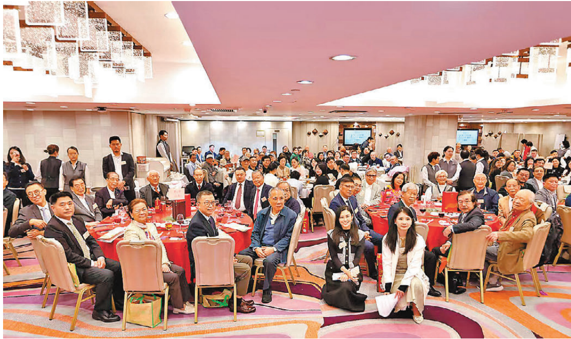
●《藝術香港》昨日舉行「十載芳華 藝韻永續」十周年慶典晚宴。