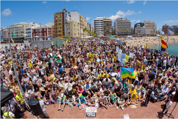
●西班牙加那利群島市民抗議「過度旅遊」。