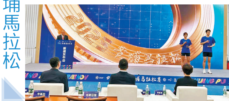
●黃埔馬拉松獎牌正式發布。

賽道方面，全程馬拉松選手將從被稱為黃埔現代產業心臟的科學城綠軸廣場啟程，途徑科學大道、開源大道，穿越永和隧道與永龍隧道。半程馬拉松賽道則通過巧妙的折返設計，讓跑者在城市核心區完成一次高效的「活力循環」。