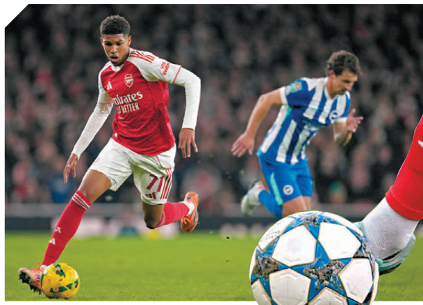
●阿仙奴前鋒夏利文安奴斯將肩負入球重任。