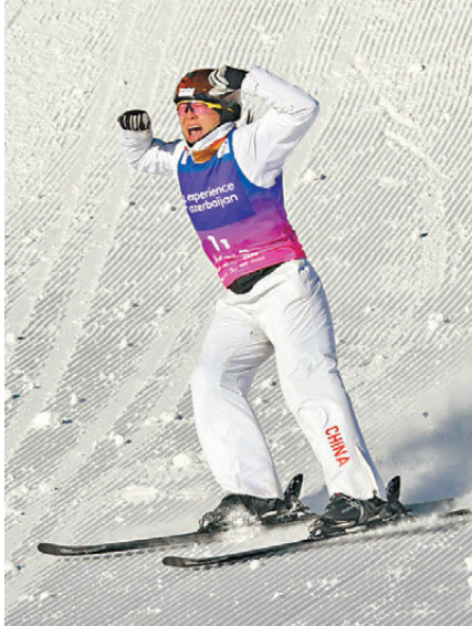
●徐夢桃在決賽中。

女選手跳完，已經為中國1隊、中國2隊確立起較大領先優勢。最後一跳，中國2隊孫佳旭落地出現失誤，中國1隊齊廣璞穩穩落地。中國1隊反超比分，以315.35分摘得金牌，中國2隊308.49分獲得銀牌。