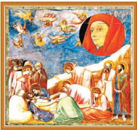
●喬托畫像和作品。

畫圈成名的大畫家 十四世紀出生的喬托（Bondonr），因為其貌不揚，自幼被人取笑為醜小鴨，七八歲那年，獨自蹲在農場一角的大石頭上畫羊群，拜占庭的老畫師齊馬布經過，看他畫得不錯，已肯定這孩子有天分，日後必是可造之才，於是問他是不是喜歡美術，自卑的小喬托害羞得不敢答話，開心地微微點一下頭，齊馬布即時便說：「小朋友，我教你！」從此欣然收他為徒，事後除了在畫室教喬托繪畫，還不時帶他到各地遊歷，觀摩四方不同的藝術。 齊馬布離世時，喬托已長大成入，懷念老師還是如常單獨出遊，跑的地方更多，眼界也就更寬，漸漸明白學無常師，開始對老師拜占庭式的畫法感到有點沉悶，嫌它構圖複雜僵硬，用色過於灰暗，決定發揮自己風格開闢新路。 如果我們細心對照一下，便發覺喬托後期作品用色的確比前簡潔明快，看去有點近似淨化了乃師拜占庭的風格，