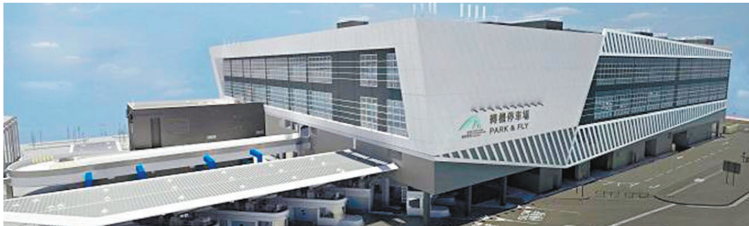
●港珠澳大橋香港口岸「轉機停車場」。

依照國標進行測試的報告，以評估車輛的自動駕駛性能。 在粵車南下安排下，符合條件並經核准的廣東私家車，可經港珠澳大橋珠海口岸前往香港口岸人工島上的自動化停車場，泊車後車輛不入境香港，司機和乘客經香港國際機場轉乘飛機或入境並轉乘香港本地交通工具訪港；或在無須取得常規配額下以