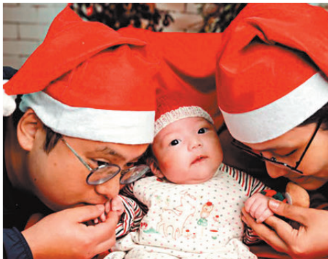
●伊利沙伯醫院為留醫的嬰兒與家人拍攝家庭照。

拍攝一輯滿載祝福的家庭照。 伊利沙伯醫院病人資源中心主任鍾振邦表示，今年共有8個家庭參加，「父母都希望記錄嬰兒成長。在可行情況下，我們亦希望讓他們一家人過第一個聖誕節，把祝福帶給小朋友；把希望帶給家人。」活動後數名媽媽向義工表示，這次經驗非常珍貴難得，十分感謝醫院的悉心安排。 除了為嬰兒拍攝家庭照，透過在拍攝前後與「家友愛」的義工們一同分享，亦讓家庭成員互相明白，彼此體諒、欣賞，促進整個家庭互相支持，也是今次活動的目的。 鍾振邦指拍攝是一個渠道，重點是聯繫起一個