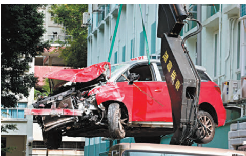
▲▲上圖為涉事的士爛如廢鐵。下圖為磚頭散滿一地。

團隊介紹，拼圖型系統乃是通過載車板垂直升降和左右橫移，以移動車輛存取，有關結構相對簡單，營運成本亦較低，善用科技提升泊車密度。此外，團隊突破技術挑戰，在拼圖型低層泊位安裝充電設施，進一步便利電動車的司機。 該停車場提供不同車種泊位，可以同時滿足私家車以及商用車輛的泊車需求。至於其他智能設備方面，停車場設有自動車輛出入管制系統、