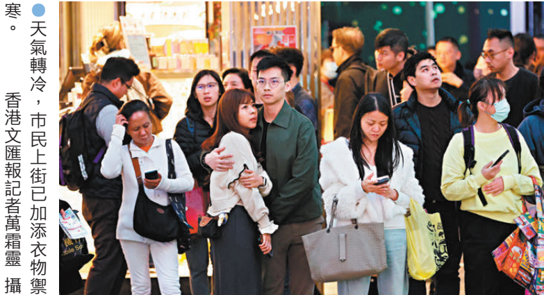
●天氣轉冷，市民上街已加添衣物禦寒。

家庭，照片的溫度也源於一家人對嬰兒的愛與祝福。他亦感謝攝影師Hazel義務幫忙，以及兒科病房醫護人員全力支持，感恩能為各家庭送上一個難忘的聖誕。