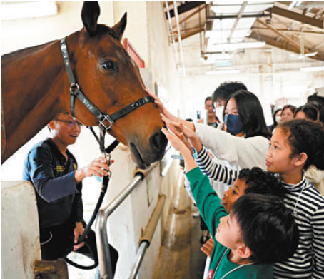
●小朋友在屯門公眾騎術學校與馬匹互動。 資料圖片