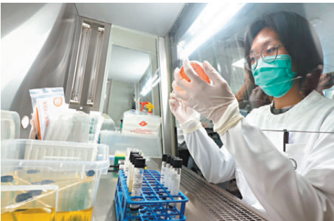
●細菌學實驗室（獸醫化驗科）化驗樣本。