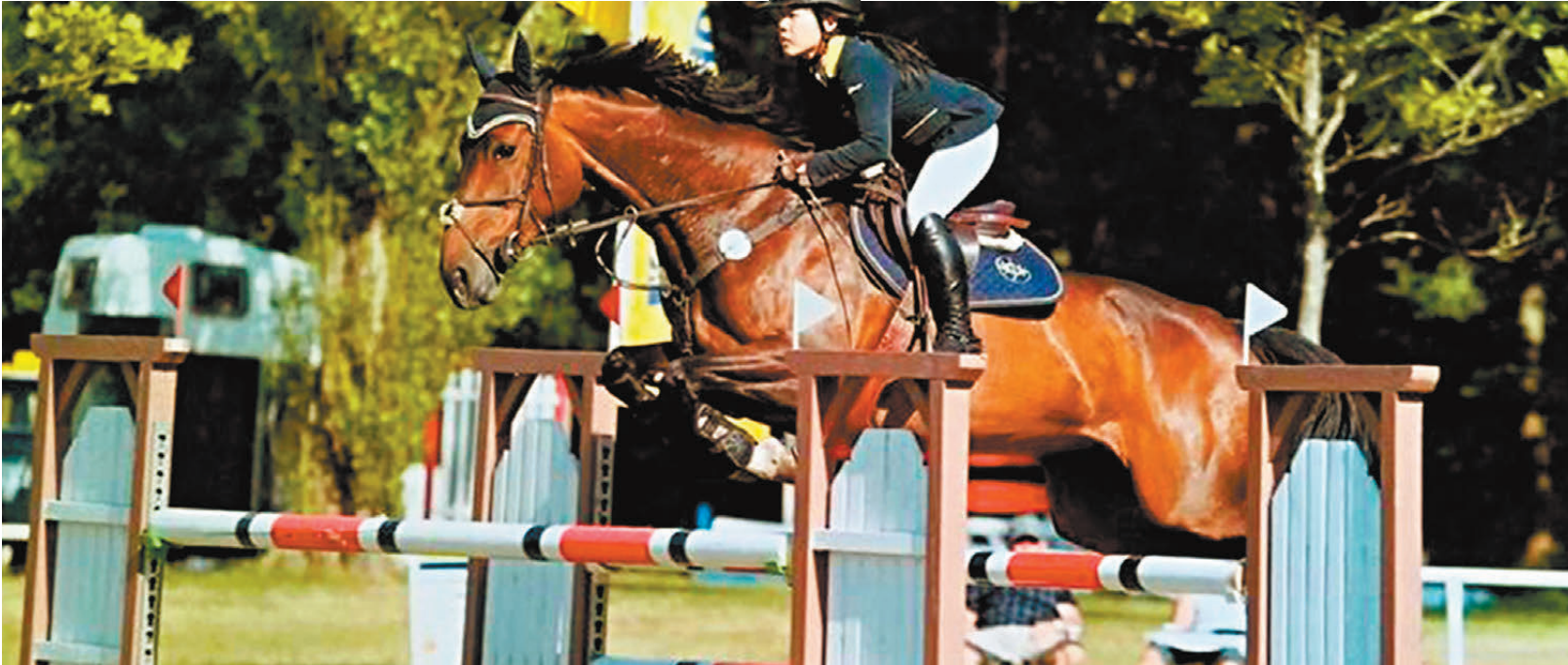
●馬會公眾騎術學校的訓練課程及活動，旨在為公眾提供體驗馬術運動的機會。

香港賽馬會計劃開設第四所公眾騎術學校，選址於將軍澳第二/三期復修堆填區並暫稱為將軍澳公眾騎術學校。馬會表示，現有三所公眾騎術學校輪候人數已逾2萬人，平均輪候時間長達數年，因此在經過審慎策劃後，決定開設第四所公眾騎術學校，期望可藉此方便新界東南的市民，以及縮短整體輪候時間，從而為香港培育出更多優秀的馬術運動員。落成後每年除設有公眾開放日外，亦會安排定期參觀及小馬試騎活動，讓公眾可親身感受及了解馬術運動的專業性和訓練要求。該項目已獲香港特區政府文化體育及旅遊局原則上支持，以及環保署同意。馬會將根據相關程序，於明年第一季向城規會提出規劃許可申請，預計工程最快可於2027年底展開，需時約24個月，並於2030年正式開放予公眾使用。 ●香港文匯報記者 費小燁