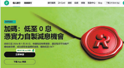
●ZA Bank推出「自製減息」計劃，更用低至「0息」作招徠。

另外，其他銀行的稅貸利率亦相當優惠，例如匯立銀行稅貸的最低年利率為0.65厘，貸款額最高為150萬元；螞蟻銀行（香港）稅貸的最低年利率為0.68厘，貸款額最高為150萬元；東亞銀行的最低年利率則為1厘，貸款額最高為400萬元；至於大新銀行的最低年利率則為1.18厘，貸款額最高為200萬元（詳見配表）。