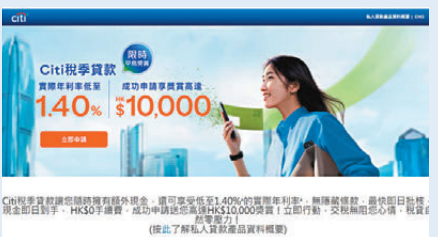
●花旗銀行稅季貸款以「最快即日起批核，現金即日起到手」為賣點。

至於數字銀行則更為進取。ZA Bank早前宣布為其稅季貸款推出矚目「自製減息」計劃，將用戶貸款利息與ZA Bank賬戶總結餘直接掛鉤。即日起至2026年1月20日，用戶只要每月維持指定賬戶結餘水平，即可賺取