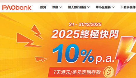
●數字銀行及傳統中小銀行在年尾紛攬儲，高息吸引定期存款。圖為PAObank網站。