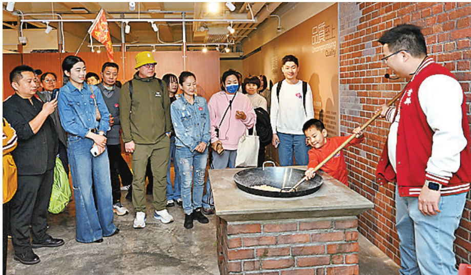
●旅客可通過體驗活動了解傳統香港餅食的製作過程。

香港文匯報訊（記者 李千尋）特區政府早前成立「發展旅遊熱點工作組」，落實推行多個項目，當中包括推廣「工業品牌旅遊」。有本地餅食集團響應號召，在大埔廠房設立體驗館，重現品牌於上海街首間門市的風貌，並於本月初接待首個來自內地的旅行團，讓旅客透過參觀及自製餅食，深入了解本地傳統餅食文化。香港旅遊業議會計劃明年3月檢視項目成效，考慮引入更多品牌。 本地餅食集團奇華餅家在大埔廠房設立的品牌體驗館，以約半年時間進行籌備，內部裝潢仿照品牌昔日於上海街開設的首間門店，營造濃厚懷舊氛圍。開放式空間設有舊式玻璃櫃台，牆上懸掛「供月餅會」懷舊廣告畫，展品亦包括早年銷售的月餅與餅食，蛋黃蓮蓉酥當年每件僅售六毫八仙，雙黃蓮蓉月餅則每盒兩元。 體驗館本月初迎來首個內地訪港旅行團，旅客紛紛在場館內打卡留念，亦在導賞員帶領下