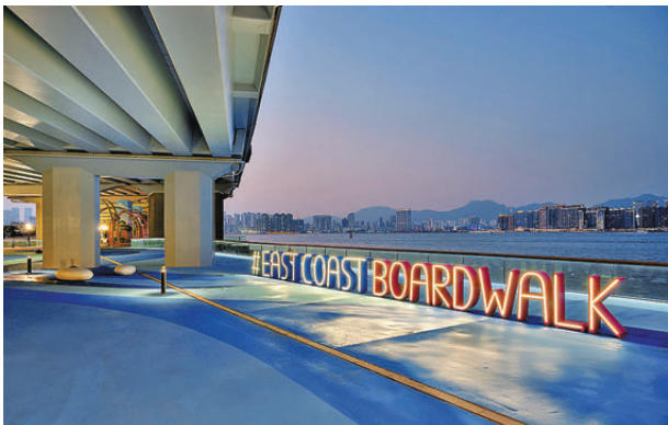
●圖為板道最東端近鯉魚涌入口的小型廣場，相連的海裕街行人路已經擴闊，提高暢達度。

位於東區走廊下的東岸板道全長約2.2公里，分東西兩段，各長約1.1公里。其中貫通東岸公園及北角海濱花園的西段今年初開放後深受歡迎，今日開通的東段則連接北角海濱花園及鯉魚涌海裕街，達至「一板貫通，暢踏西東」，而東段與西段均24小時開放。 至於東段的體驗式玻璃觀景台，則讓遊人感受腳下的維港，開放時間為早上10時至下午6時，倘天氣欠佳會暫停開放，進入觀景台的市民須穿上場地提供的鞋套，主要是為安全起見及保護玻璃。另外，近電照街的寵物友善區，讓市民與牽繩寵物放鬆放電，一起踏上板道賞維港，明年首季將開放小食亭以及可提供餐飲服務的多