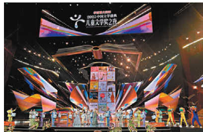
●盛大舞台展示獲獎圖書。

文心相通，我們作家都懷揣真摯的兒童文學初心，一邊品嘗精緻的早點、一邊圍繞文學的現況與發展交流，大家從兒童生活題材談到寫作手法，從新平台推廣說到兒童閱讀素質培養。此刻，我們的心意互通，思想得以碰撞，期望互勉加油，以文學守護童心，寫出更多好作品。