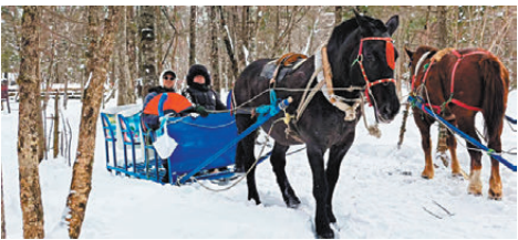
●一把紅扇與馬拉爬犁。

所以，你想要成為愛的天使嗎？或者，承受一份這樣的愛。那不需要有一個上帝給予你一個偶然的、必須要聚集一切美好的巧合，只需要你時不時做一件美好的事，這件事發生在再平常不過的一天，令對方感到意外，並且，是那種令人感到美好的意外，你就扮演了一個上帝，或者天使的角色，為你們的生活添加了浪漫的元素。這種有關生活的情趣，原本就是可以人為創造的。也許，你在準備的時候還沒有任何浪漫的感覺，可是一旦對方看到这份心意，她便會綻放出燦爛的笑容，而你則是這燦爛下的被照耀者，也成了這份恩賜的受益人。既是施予者，又是受益者。還有比這個迴環更容易獲取的禮物嗎？