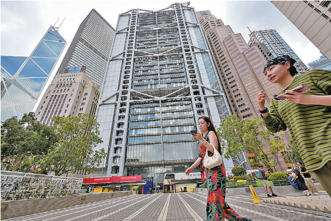
● 金管局推出的「人民幣業務資金安排」第二階段已正式生效，滙豐、中銀、渣打等銀行隨即積極響應。圖為香港中環。

銀行業界對新安排反應正面（詳見另稿）。其中作為香港唯一的人民幣清算行、及首家直接參與上海清算所利率衍生品集中清算的境外機構，中銀香港在12月1日「人民幣業務資金安排」啟動當日，即作出首批資金安排，包括為天虹國際、溢達集團、交銀租賃、恒基地產等多家企業在港辦理人民幣貸款。同時，該行積極協同中國銀行在歐洲及亞洲等地的分支機構，為當地企業客戶提供人民幣貸款及貿易融資服務，單筆提用金額逾10億元。