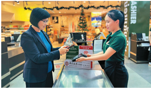
● 中銀香港萬象分行將為老撾提供數字人民幣實時匯率報價及收單清算服務，以便客戶透過數字人民幣App掃描商戶二維碼進行支付。

數字人民幣跨境數字支付平台由中國人民銀行推出，接通境內外金融基礎設施，運用央行數字貨幣提升跨境支付的效率。屆時，中國內地旅客於老撾消費時，只需透過數字人民幣App掃描老撾國家支付網絡（LAP-Net）商戶二維碼，即可直接以數字人民幣