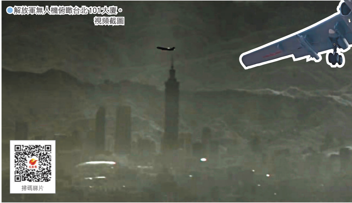
●解放軍無人機俯瞰台北101大廈。