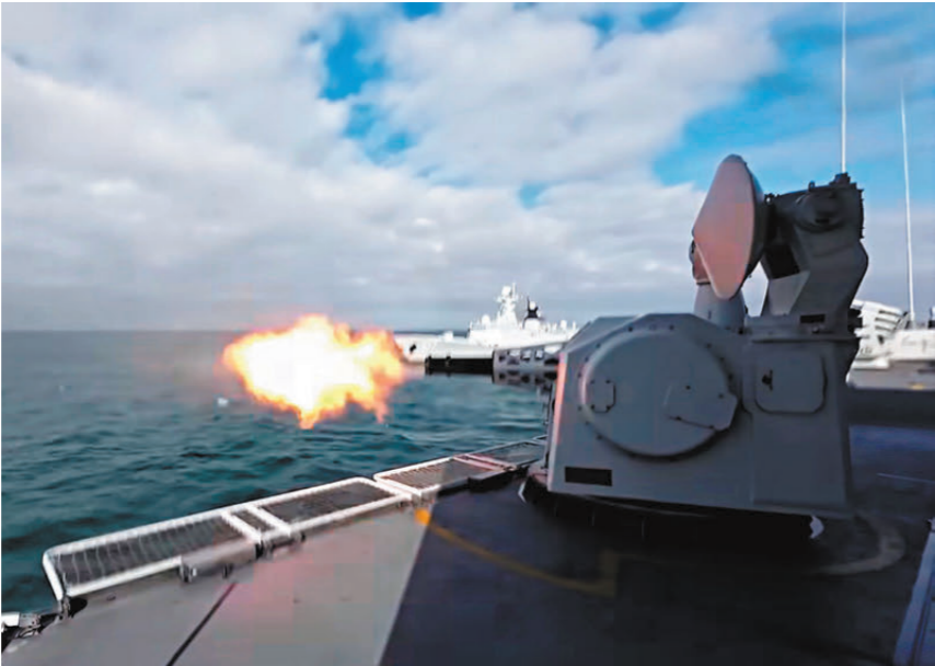
●東部戰區發布軍事演習視頻。

台灣島內輿論對軍演的核心訴求形成廣泛共識。中國國民黨主席鄭麗文透過新聞稿指出，賴清德當局的錯誤兩岸政策不斷挑釁紅線，是導致台海局勢緊張的根源，其通過仇恨動員選舉的做法正將台灣推向兵凶戰危。國民黨副主席蕭旭岑表示，台當局的冒險行徑無法帶來安全，反而會製造更多衝突。