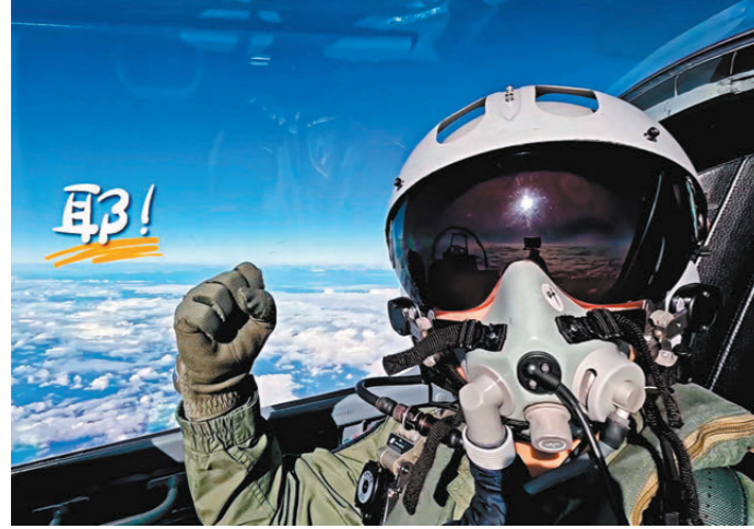
●東部戰區發布微視頻「這麼近那麼美隨時到台北」。