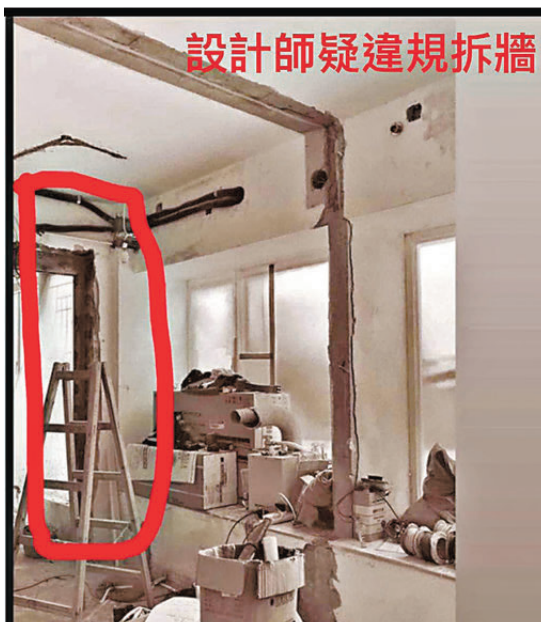
設計師疑違規拆牆

屋宇署發言人昨日表示，任何人如欲進行樓宇改動及加建工程，應先徵詢建築專業人士的意見，包括工程的可行性，以及按需要向屋宇署申請批准建築圖則及同意才可展開工程，以確保安全及不會違反《建築物條例》。建築專業人士及承建商亦須詳細查看批准圖則及其他相關文件，以及檢視《建築物條例》的相關規定和是否需要事先得到屋宇署的批准才進行有關工程，以確保佔用人及樓宇結構安全。