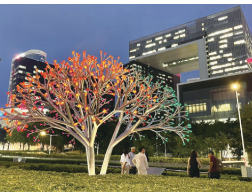
▲設置於中西區海濱長廊《光·花·聚》裝置，以再生玻璃製成，能夠發出夜光。