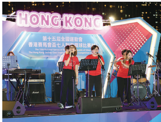
▲馬會在十五運會和殘特奧會比賽村設立互動攤位，馬會義工隊成員為市民畫上彩繪及在舞台上演出，帶動現場氣氛。