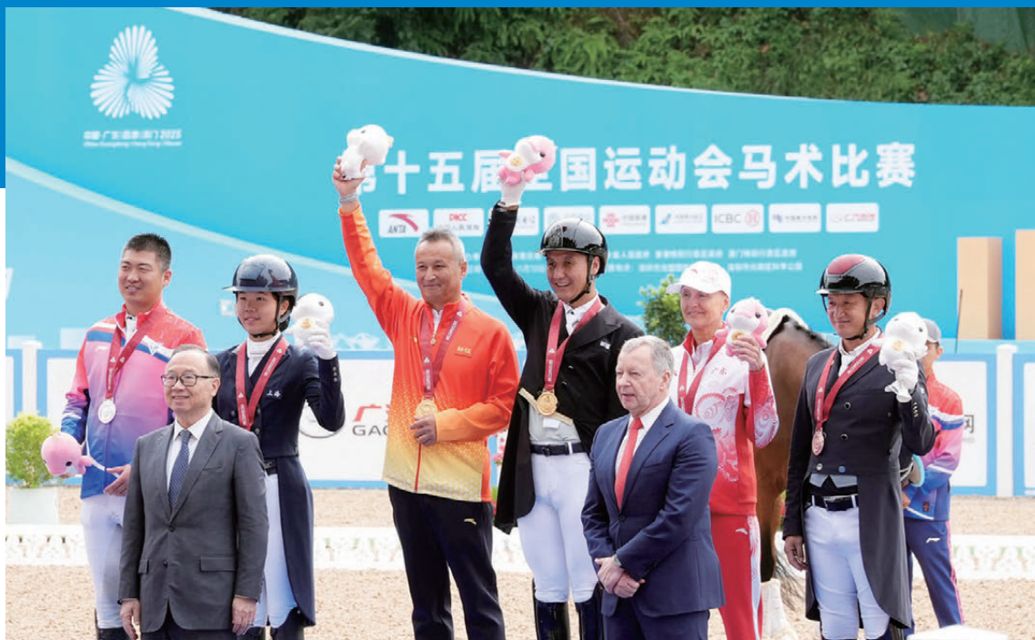
▲馬會主席廖長江（前排左）及行政總裁應家柏（前排右）向十五運會馬術賽事盛裝舞步個人賽的獲獎運動員頒發獎牌及紀念品。

家大力支持和認可馬會推動十五運會馬術賽事實施的新措施和跨境機制，成為「全國運動會先例」，在未來惠及國家及大灣區發展的其他領域。