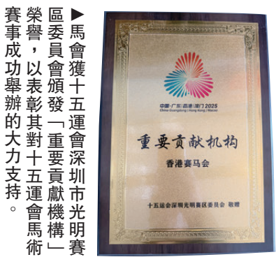
▲馬會獲十五運會和殘特奧會廣東賽區執委會頒發「公益捐贈重大貢獻單位」，並獲十五運會深圳市光明賽區委員會頒發「重要貢獻機構」榮譽，以表彰其對十五運會廣東賽區的貢獻，以及對馬術賽事成功舉辦的大力支持。