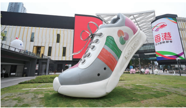
▲位於啟德車站廣場的《一步一腳印》裝置，傳遞共融合作與體育精神。