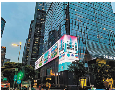
●城市地標，為一套書亮屏。

與幾場課堂分享相得益彰，深圳報業集團舉辦了「解碼地名文脈，走讀深圳記憶」活動。這是本屆讀書月的重點主題活動，前後持續了半個月，以實地走訪和座談交流為主要形式，