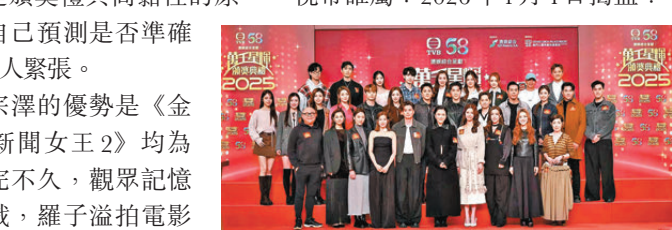
●今年視帝之爭戰況激烈，五強中，你選誰？

室，人生經歷豐富了，運用在處理「高深」一角上，流暢自然又夠Man，相當吸睛。平時好玩跳脫的宗澤，演活了「賤精總監」，無賴的語氣、威眉威眼的陰凝、風騷的奸笑，引起很多打工仔的共鳴，而宗澤勝在角色雖然乞人憎，但本尊夠靚仔。 闊別娘家14年回巢的林保怡，以實力派見稱，在《刑偵12》演人格分裂的角色，忠奸黑白，表情眼神瞬間改變，演技大爆發，這角色除了他不作第二人選。已是三屆視帝的郭晉安演技毋庸置疑，在《金式森林》的角色比較內斂，他憑經驗演技將角色演得立體，如有多些爆點或經典場面，就更有助他四度封帝。5人中，只有陳豪以《俠醫》《執法者們》雙提名，夠哢入屋，曝光率比其他對手高，觀眾緣又極好，有助票源。 視帝誰屬？2026年1月4日揭盅！