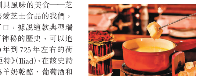
●我們家的聖誕傳統美食之一：芝士火鍋。

材稀少，瑞士山區的農民便利用剩麵包和乳酪做菜。而現代將融化的乳酪和葡萄酒一同放在鍋裏用明火煮沸的烹飪方法，就源起於19世紀末，在日內瓦邊境附近的法屬羅納-阿爾卑斯區。時光飛逝，1930年，瑞士乳酪聯盟(Swiss Cheese Union)宣布這道美食為國菜。 日內瓦的乳酪火鍋大都是由坐落於阿爾卑斯山麓瑞士著名的格律耶爾(Gruyère)乾酪和弗里堡風味的愛蒙塔(Emmental)軟乳酪對半混合而成，傳統製作方法是將這兩種乳酪一起磨碎並融化，配以蒜汁、白葡萄酒和櫻桃白蘭地，然後放在一種稱為Caquelon的平底砂鍋中，將砂鍋置於便攜爐上，耐心慢火烹調，確保混合物不斷冒泡，用長叉夾着鄉村風味的麵包，打旋浸入鍋中，跟住就可以大快朵頤了…… (待續)