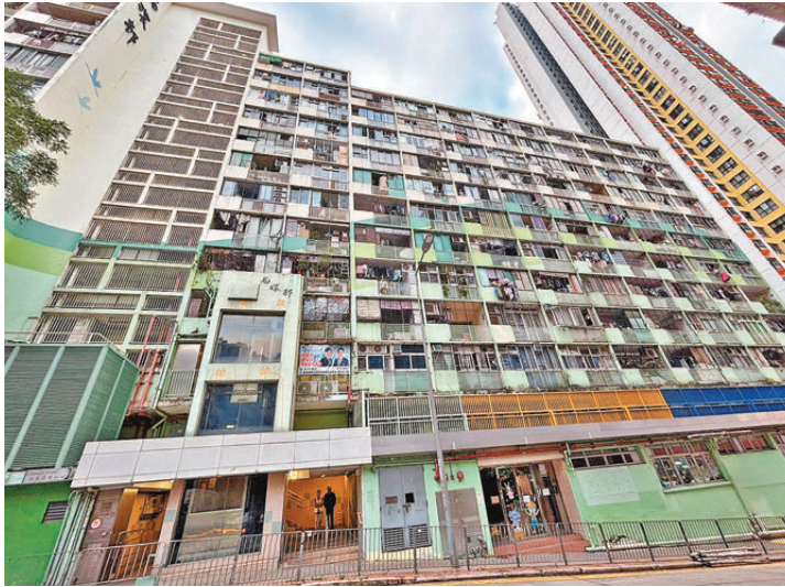
西環邨將在2029年搬遷居民。

特區政府會為受影響的西環邨住戶提供足夠的遷置資源，並在資源許可情況下讓受影響住戶遷往其選擇的任何地區的合適翻新公屋單位。至於香港基督教女青年會西環松柏中心及摩星嶺街坊福利會兩個現時邨內的服務團體，將重置於加惠民道第一期；