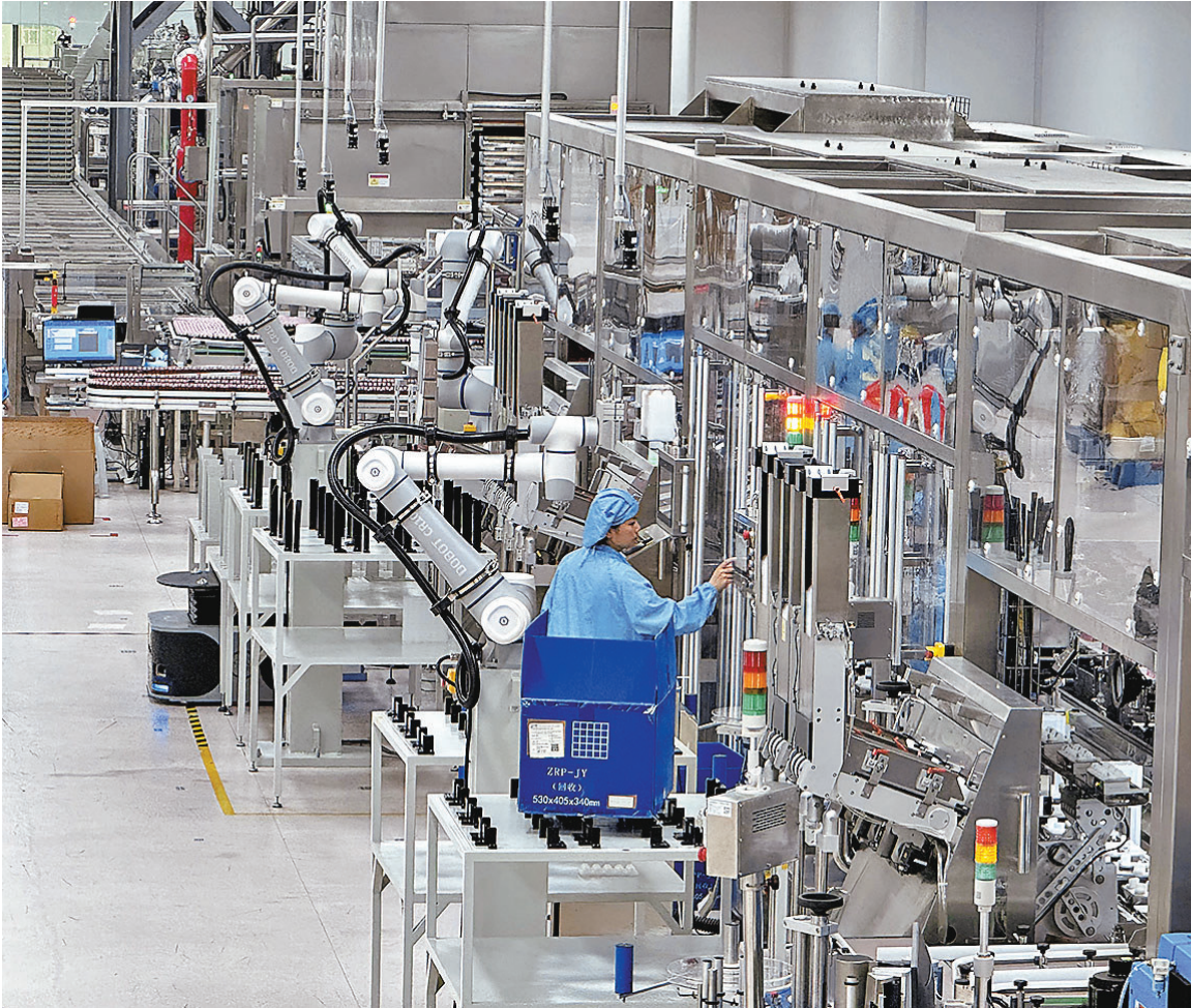
●報告顯示，2024年，中國製造業頂壓前行、向新向優，成為繼美國、德國、日本後第四個邁入全球製造強國行列的國家。圖為某先進製造業車間。

創新綠皮書——技術路線圖（2025）》提出，預計到2030年，中國信息通信設備、先進軌道交通裝備、船舶與海洋工程裝備、電力裝備、新能源及智能網聯汽車、紡織、家用電器7個產業將繼續保持世界領先水平，並在原始創新上有所突破。