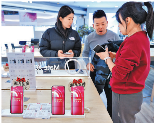
●2026年「國補」將數碼產品購新補貼拓展為數碼和智能產品購新補貼。圖為早前，消費者在北京一商場內選購手機產品。 資料圖片

香港文匯報訊（記者 任芳頤 北京報道）備受期待的2026年「國補」來了。國家發展改革委、財政部印發《關於2026年實施大規模設備更新和消費品以舊換新政策的通知》30日對外發布，明確2026年「兩新」政策支持範圍、補貼標準和工作要求。其中提到，家電以舊換新補貼支持範圍聚焦冰箱、洗衣機、電視、空調、電腦、熱水器6類家電中1級能效或水效標準的產品，按產品銷售價格的15%給予補貼，單件補貼上限為1,500元