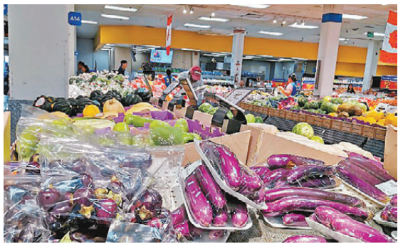
●加拿大百物騰貴，民眾難負擔日常開支。