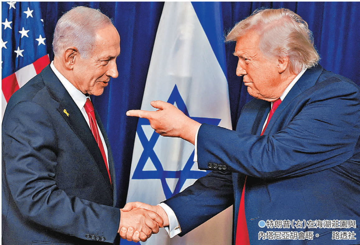
●特朗普(右)在海湖莊園與內塔尼亞胡會晤。

消息指出，特朗普領導的負責協助監督加沙治理的「和平委員會」，以及部署至加沙的國際穩定部隊，目前幾乎沒有公開確認的細節，以軍在加沙地帶並未停止軍事行動。然而特朗普聲稱就巴以和平協議，以色列已經履行義務，被問及若巴勒斯坦武裝組織哈馬斯不放下武器，他會採取何種行動時，特朗普警告稱其後果嚴重：「他們要付出地獄般的代價。」 伊朗最高領袖哈梅內伊的政治顧問沙姆哈尼周二強硬回應稱，伊朗的導彈和防禦能力不會受任何外部控制：「任何針對伊朗的侵略行為，都將遭到伊朗嚴厲且迅速的回應，其力度將遠超侵略者的預期。」