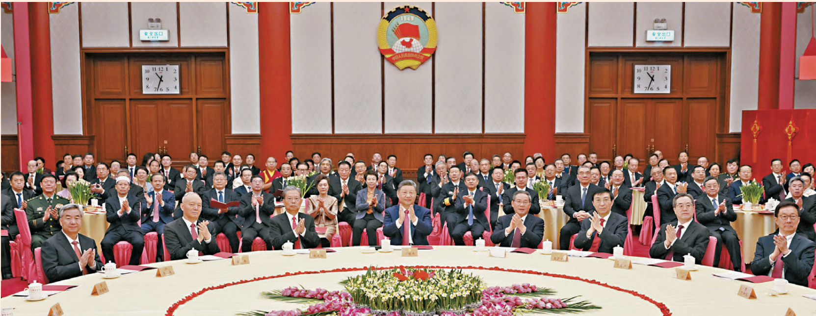
●2025年12月31日，全國政協在北京舉行新年茶話會。黨和國家領導人習近平、李強、趙樂際、王滬寧、蔡奇、丁薛祥、李希、韓正出席茶話會並觀看演出。