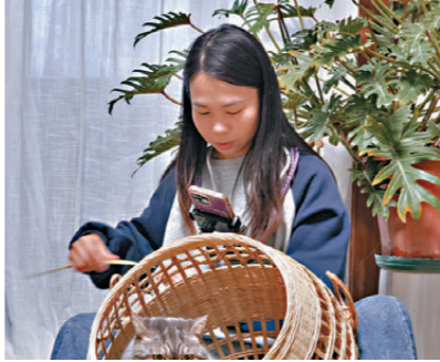
香港文匯報廣西傳真

過去五年，最讓我驚喜的還是科技和社會發展帶來的便利。從前，好手藝得靠擺攤，靠口口相傳；現在，我打開手機直播，就能跟全國各地的朋友面對面，給他們看一根竹子如何被破開、剝成篾，再在我手裏一點點成型。那種即時的交流和反饋，甚至直接催生了像「爆款編窩」這樣有趣的產品。如今發達的物流和移動支付，真像是一把鑰匙，徹底打開了我們偏遠山村連通外面廣闊天地的樊籠。 下個五年，我最期待的就是能獲得更多專項貸款支持，給竹編產業升級添把勁；用年輕人聽得懂、喜歡聽的時髦語解說竹編，再把竹編和國風、潮玩元素結合起來，讓更多年輕人願意靠近這份傳統；還想和知名品牌跨界聯名，拓展竹編的使用場景，再向高端定製方向發展。我相信，「未來，我們竹編的故事一定會更精彩。我們的 lives，也會像這手裏越編越緊實的竹器一樣，經緯交錯，光亮而結實。」