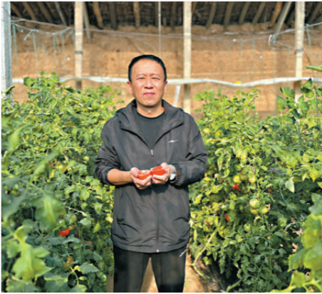
香港文匯報陝西傳真

這顆小小的西紅柿，既承載着我的創業夢想，也是過去五年中國特色農業現代化跨越式發展的真實寫照。五年來，隨着越來越多的現代設施裝備武裝農業，現代科學技術服務農業，我國農業科技創新成功躋身世界第一方陣，農作