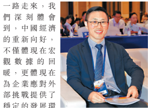
香港文匯報東莞傳真

面對美國保護主義政策引發的全球產業鏈波動，我們早年布局的全球化戰略發揮了關鍵作用。2016年，我們在瑞士設廠，通過「中國製造零配件、瑞士組裝」的模式，滿足瑞士「Swiss Made」的有關條例，不僅讓我們抵禦了外部環境的不確定性，更讓歐洲業務規模幾乎翻了一倍。這