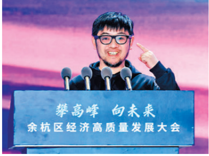
香港文匯報浙江傳真

成立11年來，今年可以說是 Rokid Glasses 最火的一年。火到什麼程度呢？年初我戴着它走上余杭區經濟高質量發展大會，當時我指着眼鏡說，「我的發言稿就在這副眼鏡中，再也不需要背稿了。」就這