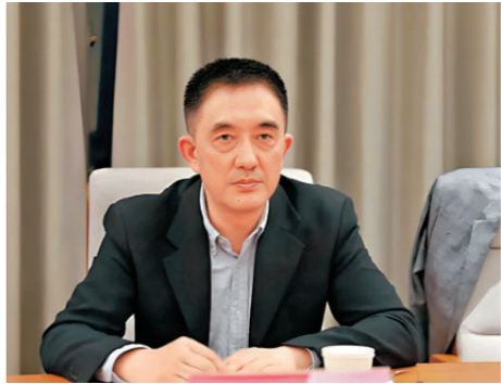
香港文匯報廣州傳真