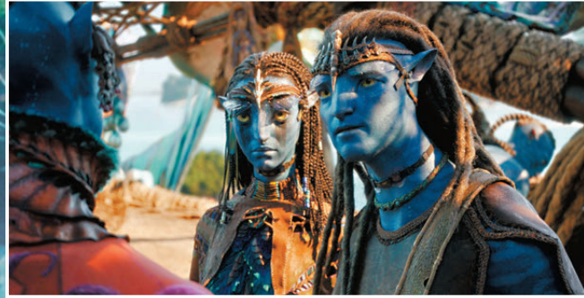
● 《阿凡達3》由原班人馬回歸主演。