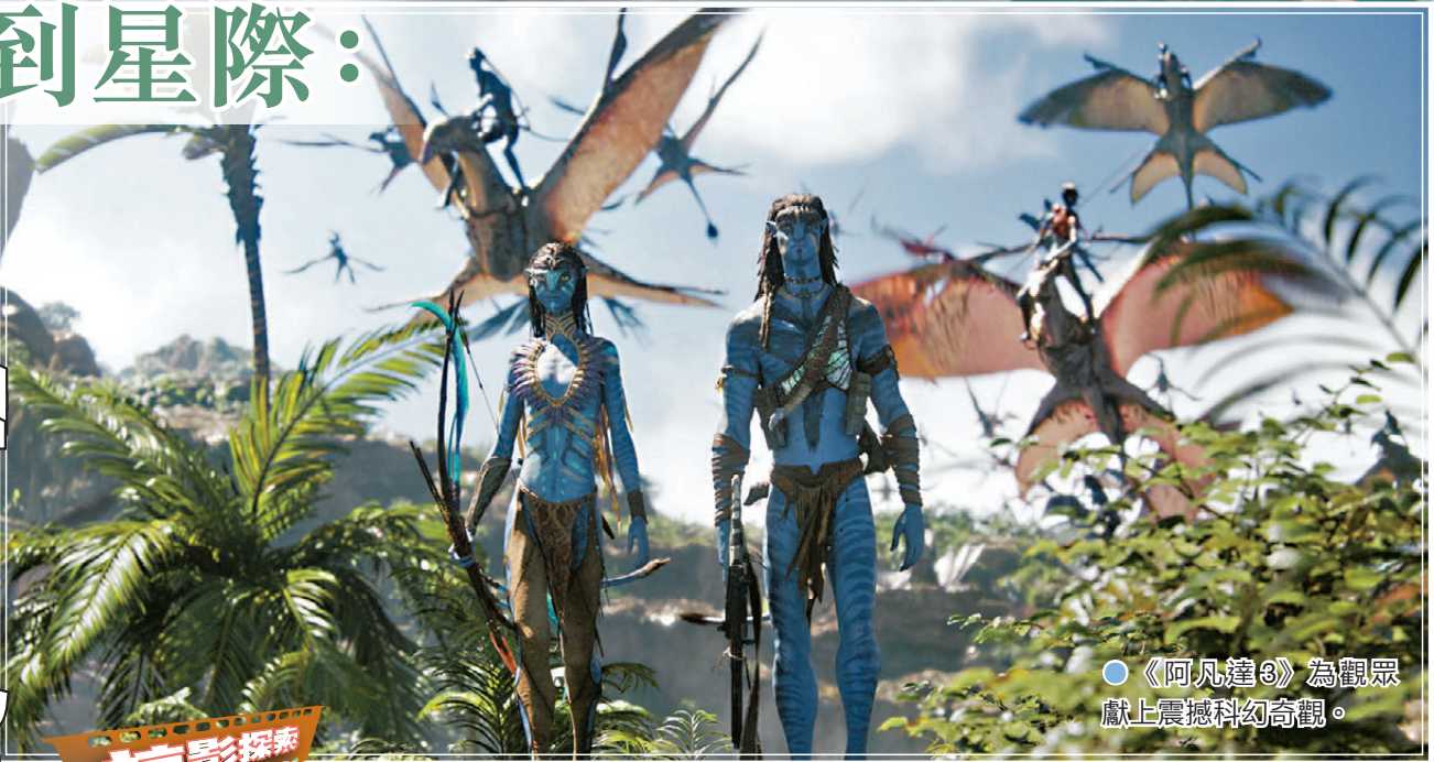
● 《阿凡達3》為觀眾獻上震撼科幻奇觀。

真人版《魔海奇緣》與《阿凡達3》這兩部電影看似毫無關連，實際上在2025年的電影版圖上形成了有趣的對話。它們代表着當代電影業兩種截然不同的想像力路徑：一種是向內深耕特定文化傳統的真人化改編，另一種則是向外擴張完全原創的科幻宇宙。