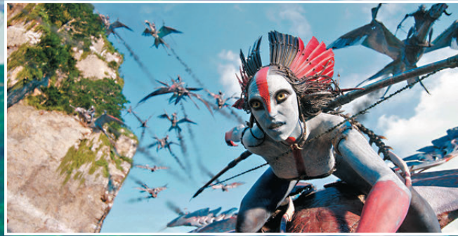
● 《阿凡達3》將於1月8日在香港正式上映。