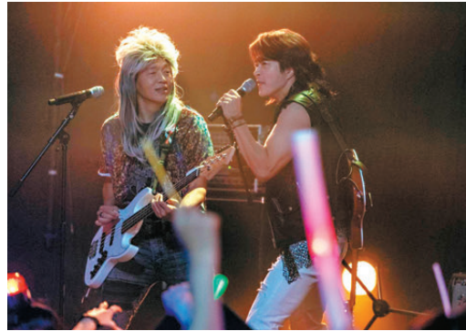
● 權相佑又唱又跳，使出渾身解數。