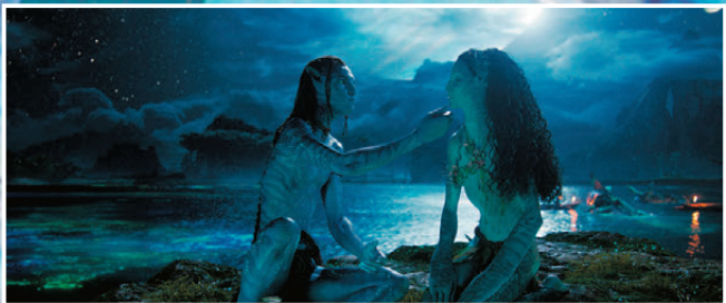
● 影片讓觀眾在大銀幕上真正「活」在潘多拉的世界。