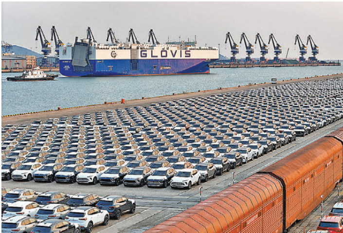
●歐盟提出立法草案，計劃從2028年起將CBAM範圍擴展至包括機械裝備、汽車等約180種產品。圖為大批國產汽車在山東港口煙台港等待裝船出口。

水平，打着防止「碳洩漏」的氣候幌子推行新的貿易保護主義，將自身碳標準強加於發展中國家，造成氣候與貿易治理規則衝突，抬升發展中國家氣候行動成本，嚴重損害國際社會互信，與各方合作應對氣候變化、推進可持續發展的努力背道而馳。希望歐方遵守氣候和貿易相關國際規則，摒棄單邊主義、保護主義，保持市場開放，本着公平、科學、非歧視的原則，促進綠色領域貿易投資自由化便利化。中方願與歐方相向而行，合作應對全球氣候變化挑戰，但將堅決採取一切必要措施，回應任何不公平的貿易限制，維護自身發展利益、中國企業合法權益和全球產業鏈供應鏈的穩定。