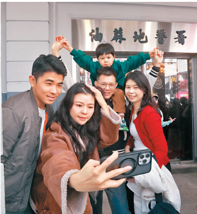
▲有不少到場打卡的內地旅客表示，事先不知道有這個展覽，惟因沒有名額未能參觀，只好在油蔴地警署門口拍照留念。