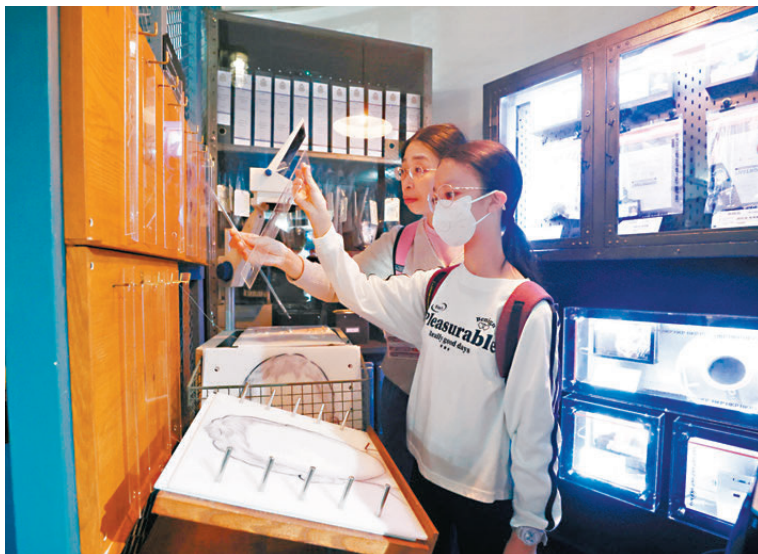
●伍女士及11歲女兒入場，期望展覽可增設角色扮演等環節。