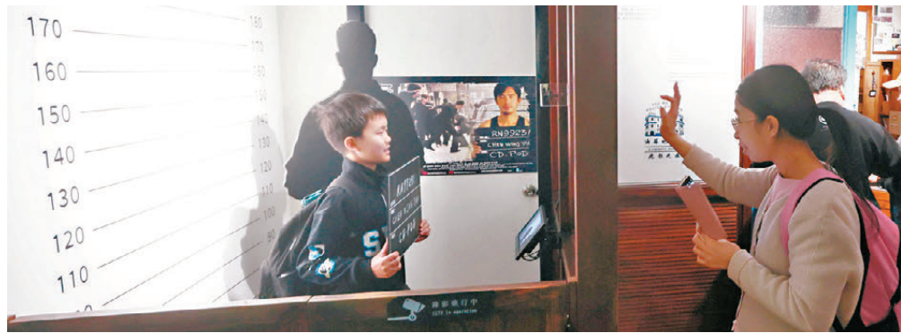
●參觀者可以一嘗影犯人相的感覺。