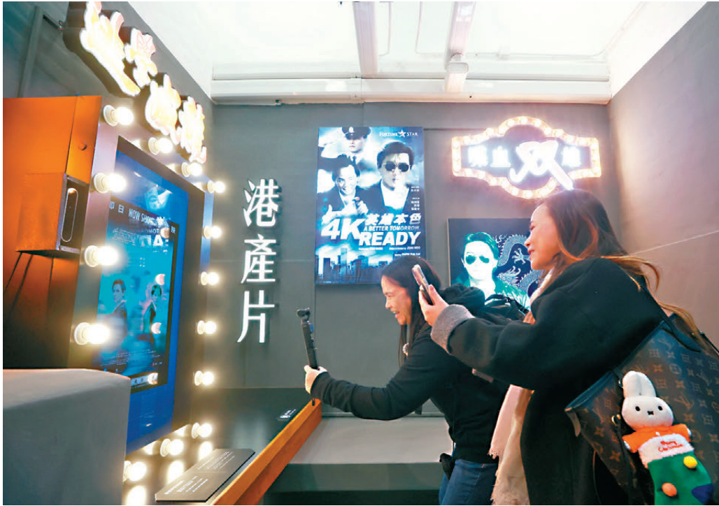
●現場布置《英雄本色》等經典警匪片的電影海報，懷舊味十足。