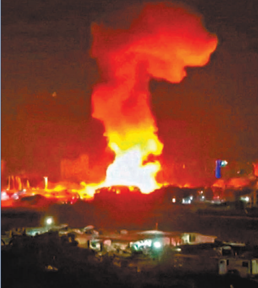
●加拉加斯爆炸，冒出大量濃煙。