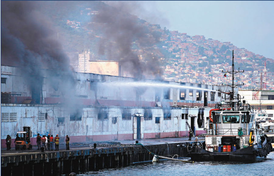
●拉瓜伊拉港一個碼頭被轟炸後起火。