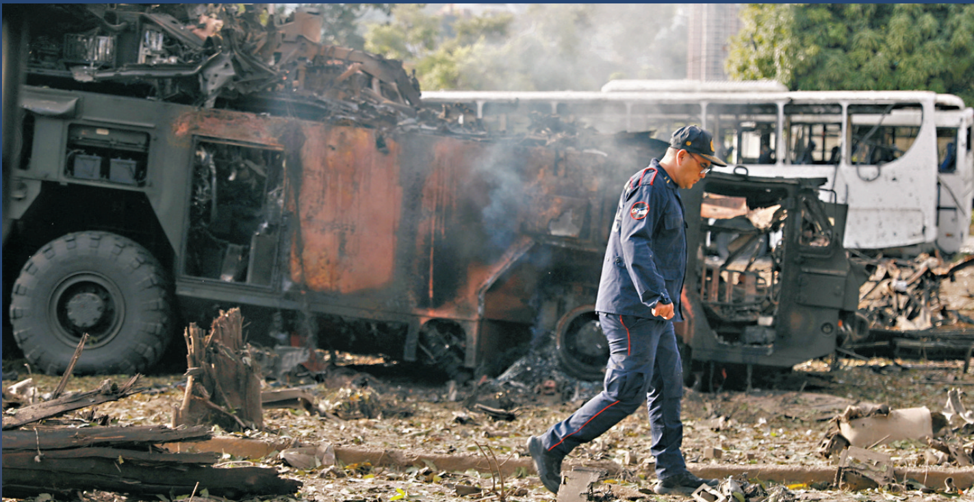
●委內瑞拉一個軍事基地一輛防空導彈車被摧毀。